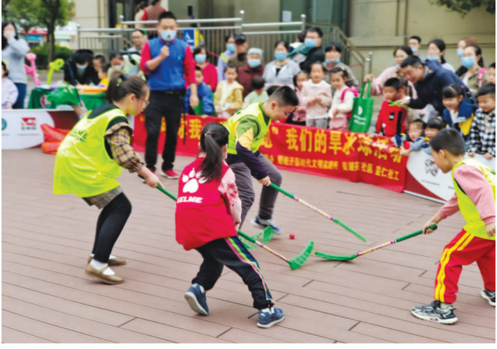
小朋友在小区里锻炼健身。

晨晖中或是夕阳下，在该经开区四季花海体育公园内，到处都能看见锻炼的人，他们中既有年过半百的老人，也有活力四射的中年，还有朝气蓬勃的孩童，在酣畅淋漓的运动中展现出全民健身的别样风采。为了让居民积极投身体育健身，该经开区始终将推动全民健身作为重要目标来抓，结合实际，不断加强