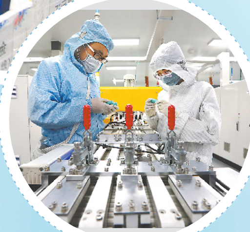
▲ 马鞍山经开区蜂巢能源科技有限公司职工在检验新下线的锂电池电芯产品。