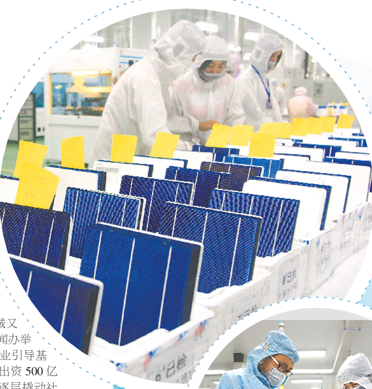
▲ 合肥赛维LDK太阳能生产线。(资料照片)