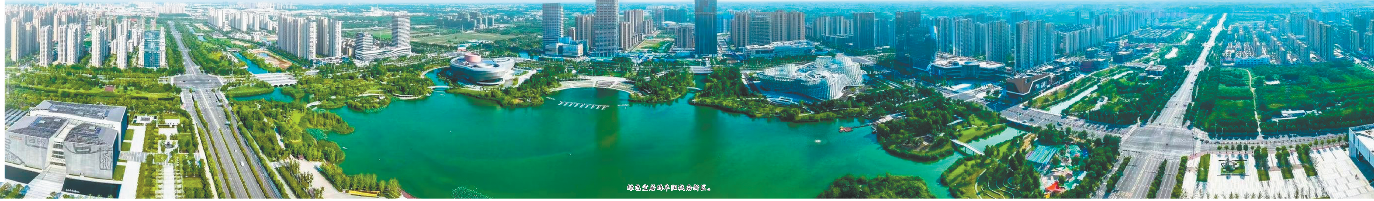
特色宜居的阜城城南新区。