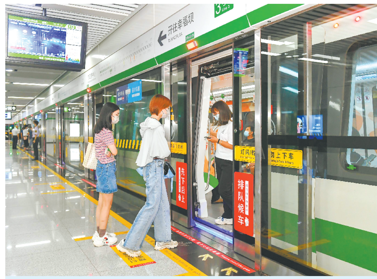
7月26日,合肥市民在市政服务中心站乘坐轨道交通3号线。截至当日,合肥轨道交通网总客流突破10亿人次。自2016年12月26日正式开通一号线,合肥轨道交通从一条线、24.58公里、23座车站,发展到现在的五线联运、156公里、122座车站,已安全运营2038天。

来安精准监督职业技能培训促就业 本报讯(通讯员 吕华)今年以来,来安县纪委监委将监督“触角”延伸至职业技能培训,促进企业用工,提高社会就业率。来安县纪委监委驻政府办纪检监察组对该县开展的职业技能培训班进行全流程、跟进式监督,重点对培训班参训人员、师资配备、课程安排等内容开展检查,对培训班中出现的学员出勤率低、代签到等问题及时予以纠正,确保培训取得实效。该纪检监察组已全程监督49期培训班,服务企业51户次,累计服务企业3426人次。来安县纪委监委牵头督促人社、工会等相关部门在做好技能培训的基础上,充分发挥桥梁纽带作用,建立企业用工动态调整机制。截至目前,该县已对87场次招聘会筹备运作情况进行监督,累计服务企业942户次,促成用工意向人数13606人,帮助企业招工7013人。