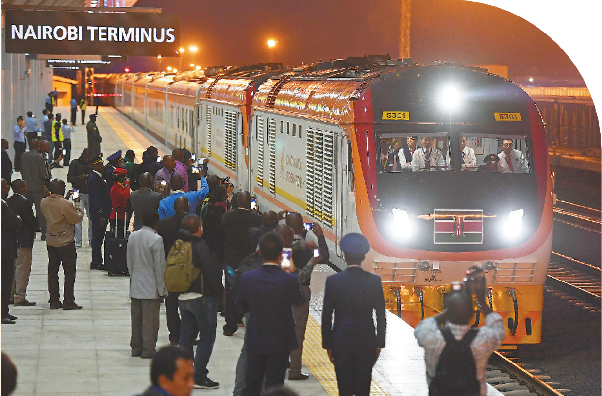
▲ 2017 年 5 月 31 日,在肯尼亚首都内罗毕,首班从蒙巴萨发出的列车到达蒙内铁路内罗毕南站。五年来蒙内铁路累计发送旅客 778.5 万人次,单日旅客最高发送量突破 10000 人次。