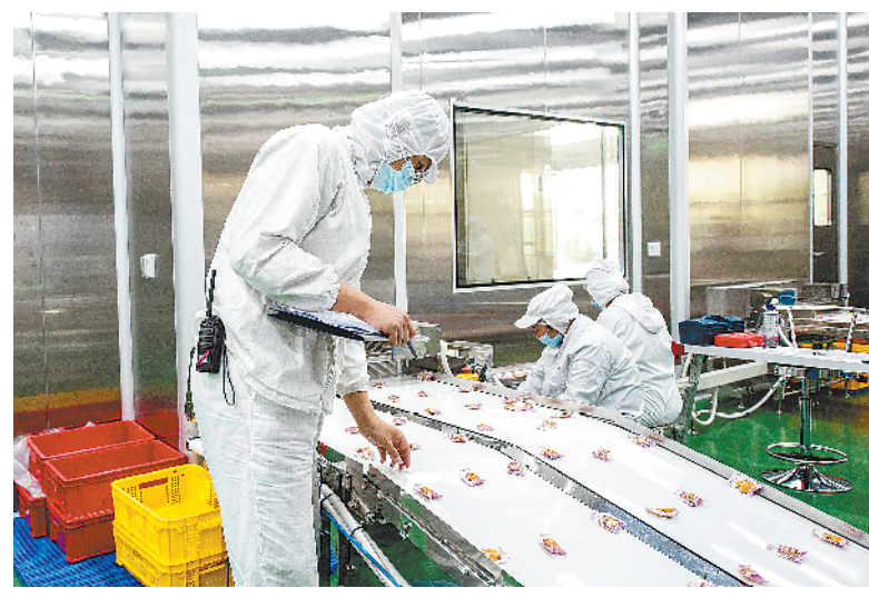
繁昌经济开发区溜溜果园企业员工在生产线上忙碌。