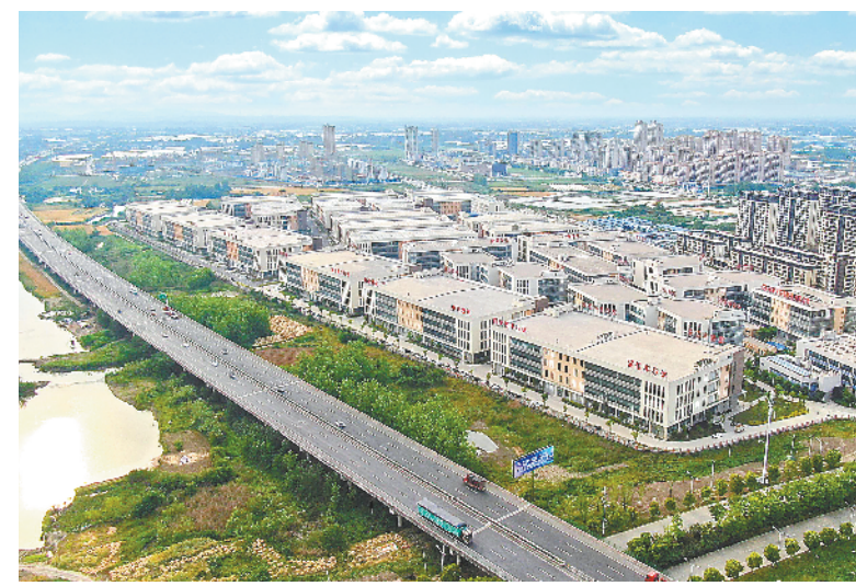
马鞍山郑蒲港新区半导体产业园。

马鞍山市委主要领导表示,下一步,该市将拉高标杆,苦干实干,争先创优,全力争做“三高地、两先锋”,为建设现代化美好安徽作出应有贡献。