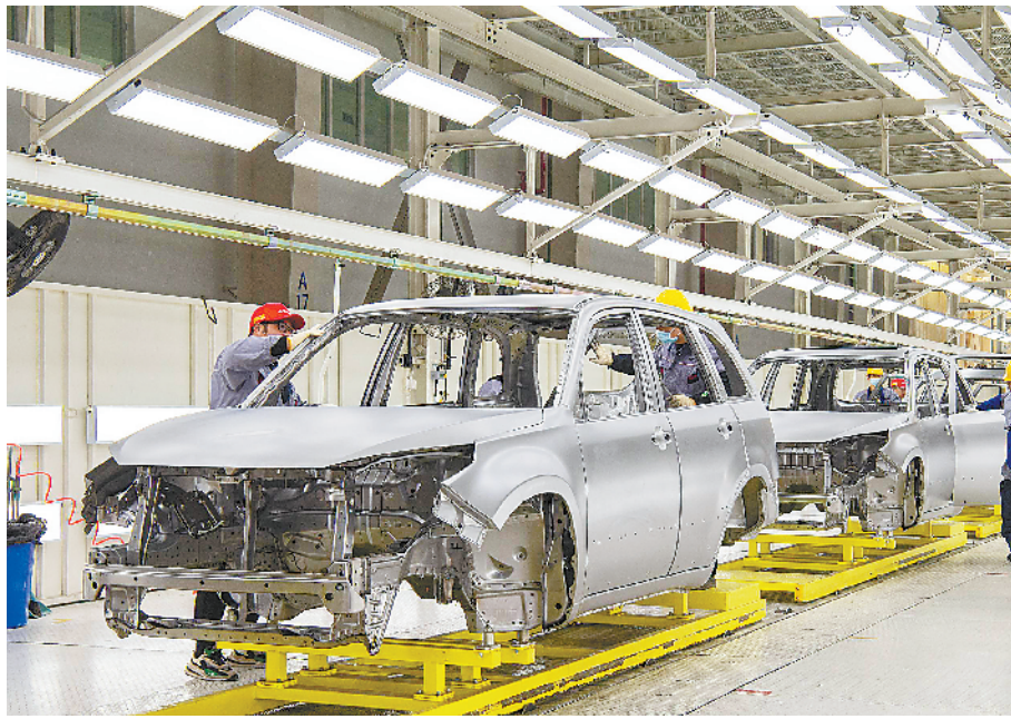
位于安庆经济开发区的安庆振亚汽车有限公司,生产线开足马力生产新能源汽车。

为将人才优势转化为“双招双引”的胜势,安庆市提出“内搭平台、外联老乡”的发展路径,即对内夯实园区平台、资本平台、