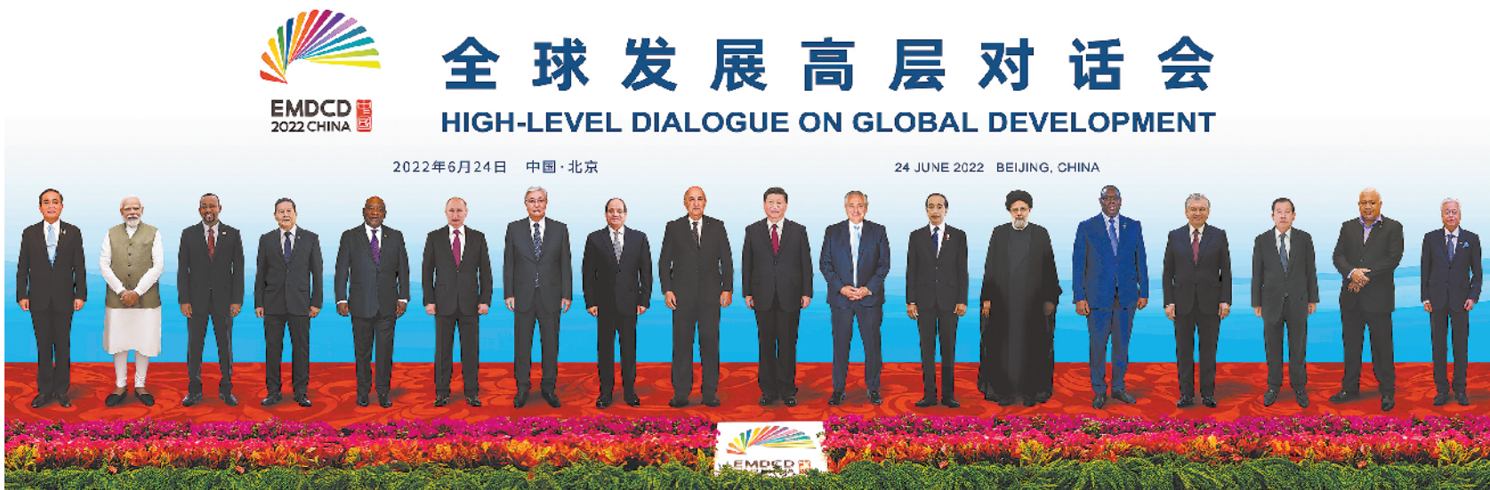
6月24日晚,国家主席习近平在北京以视频方式主持全球发展高层对话会并发表题为《构建高质量伙伴关系 共创全球发展新时代》的重要讲话。