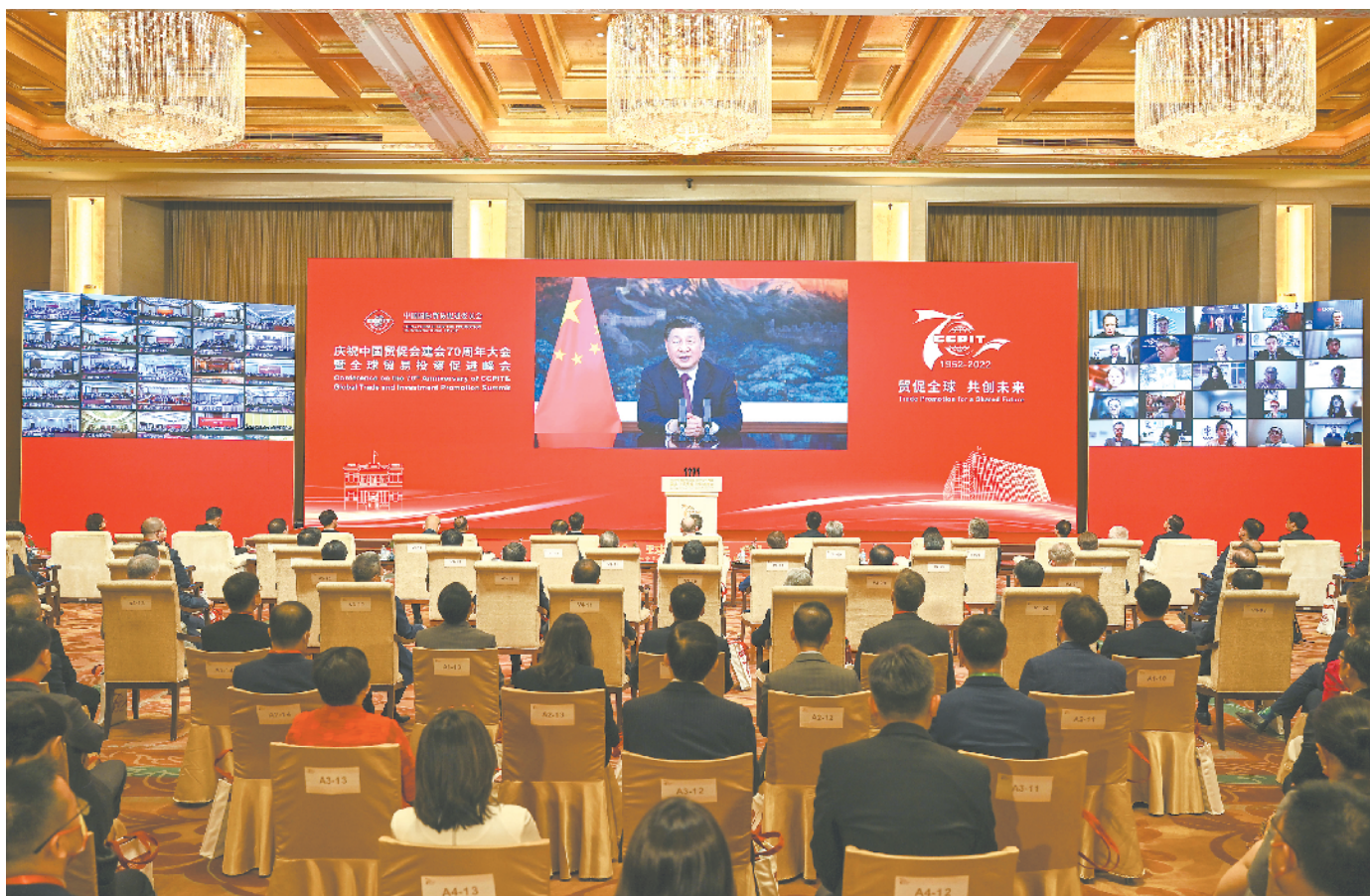
5月18日,国家主席习近平在庆祝中国国际贸易促进委员会建会70周年大会暨全球贸易投资促进峰会上发表视频致辞。