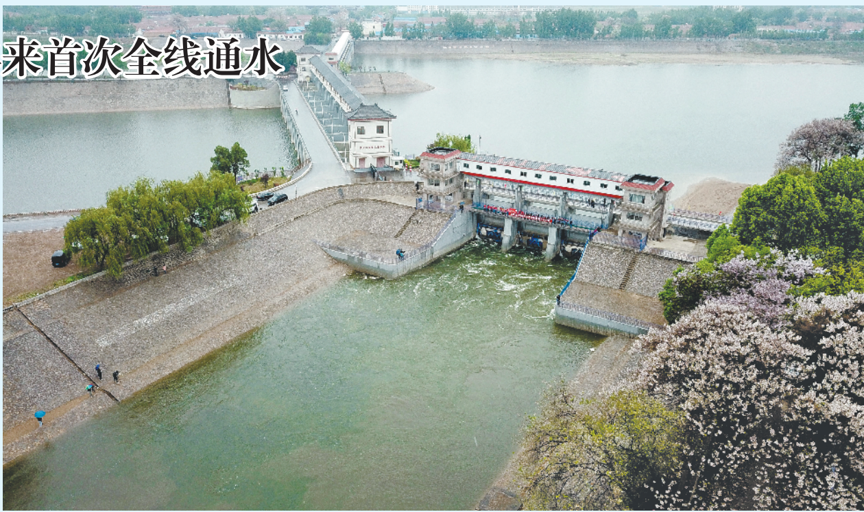
4月28日，山东省德州市四女寺枢纽南运河节制闸开启，对京杭大运河全线贯通补水（无人机照片）。

水利部今年4月至5月实施京杭大运河2022年全线贯通补水行动，至28日实现全线通水，京杭大运河百年来首次全线水流贯通。