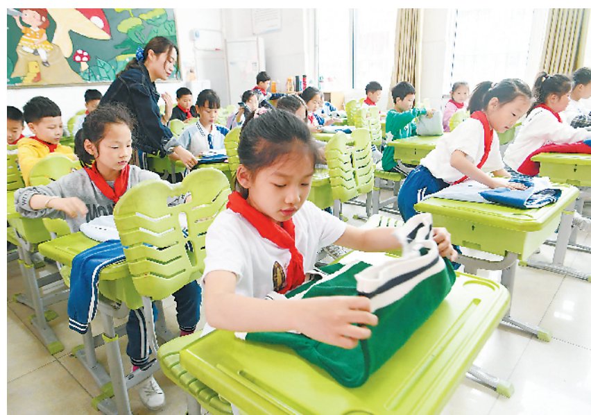
4月28日,亳州市谯城区风华桐路小学举行“强国复兴有我 致敬最美劳动者”“五一”国际劳动节主题教育活动。图为小学生在课堂上参加“争做劳动小能手”比赛。

4月28日,副省长周喜安线上出席由中国人民对外友好协会和美国国际姐妹城协会共同主办的“中美友城对话”活动并在开幕式上致辞