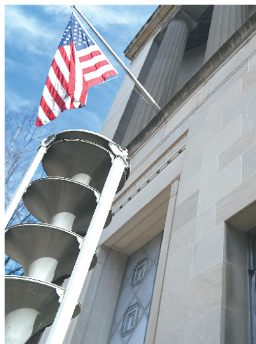
这是3月10日在美国首都华盛顿拍摄的美国司法部大楼。