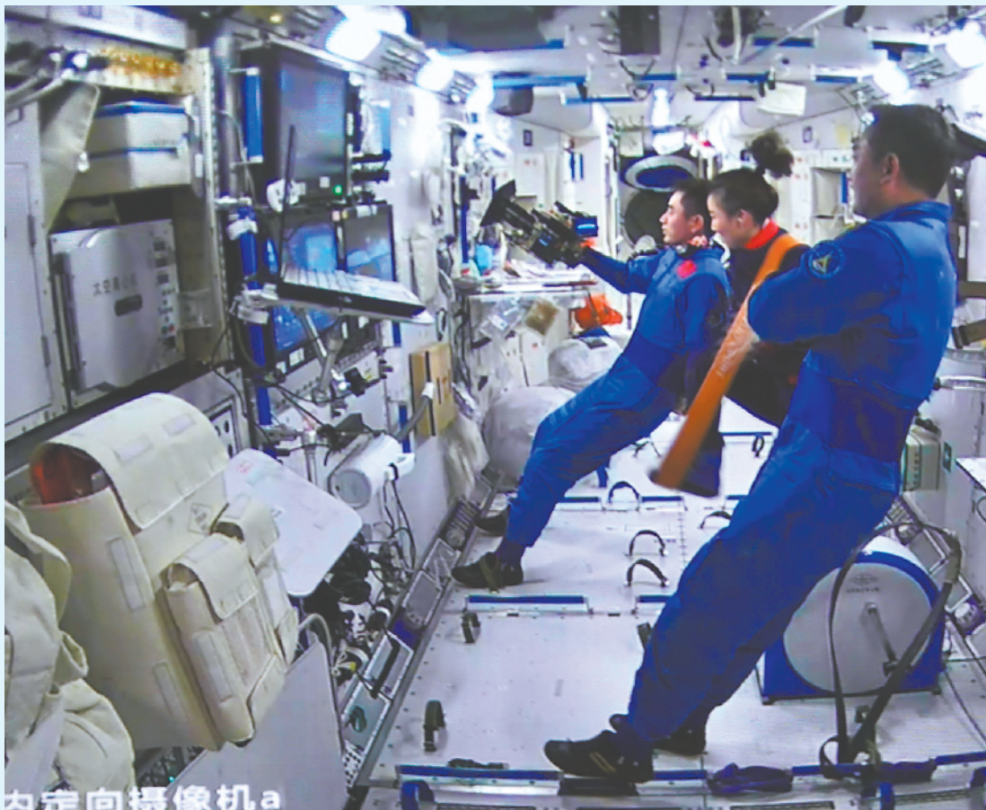
空间站核心舱组合体图像。这是神舟十三号飞行乘组航天员实时监控天舟二号撤离情况。

天舟二号是中国天宫空间站关键技术验证阶段发射的首艘货运飞船,于2021年5月29日在海南文昌发射场发射入轨,为空间站送去6.8吨物资补给。