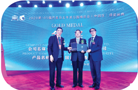
宣酒获得第105届巴拿马万国博览会金奖。

没有不更新的市场,只有不创新的产品。宣酒10不仅够新、够潮、够醇厚,也代表了中国传统工艺与时代气息的进一步融合。宣酒人立足市场潮头,将继续书写行业传奇。