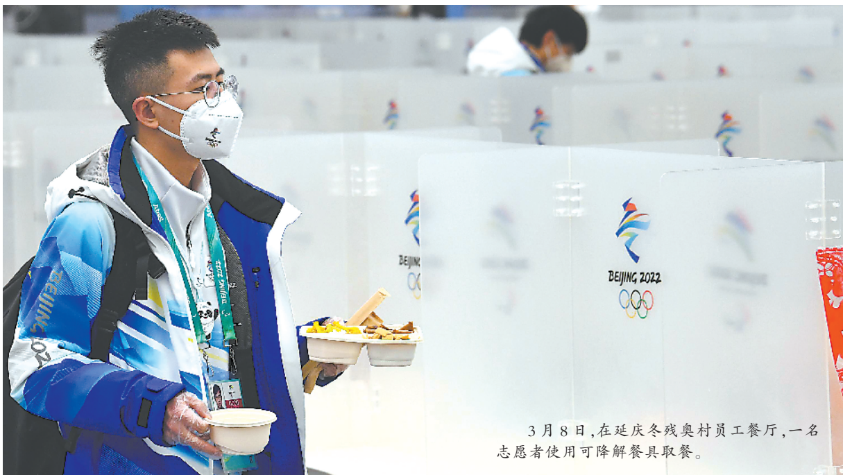
3月8日，在延庆冬奥村员工餐厅，一名志愿者使用可降解餐具取餐。