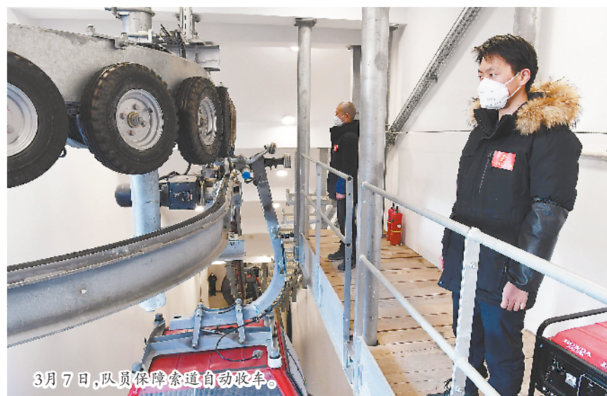
3月7日，队员保障索道自动跑车。

冬残奥会已经结束，3月14日，黄山索道团队开始在岗隔离期。经过一番寒彻骨，迎接他们的将是家乡的春暖花开。