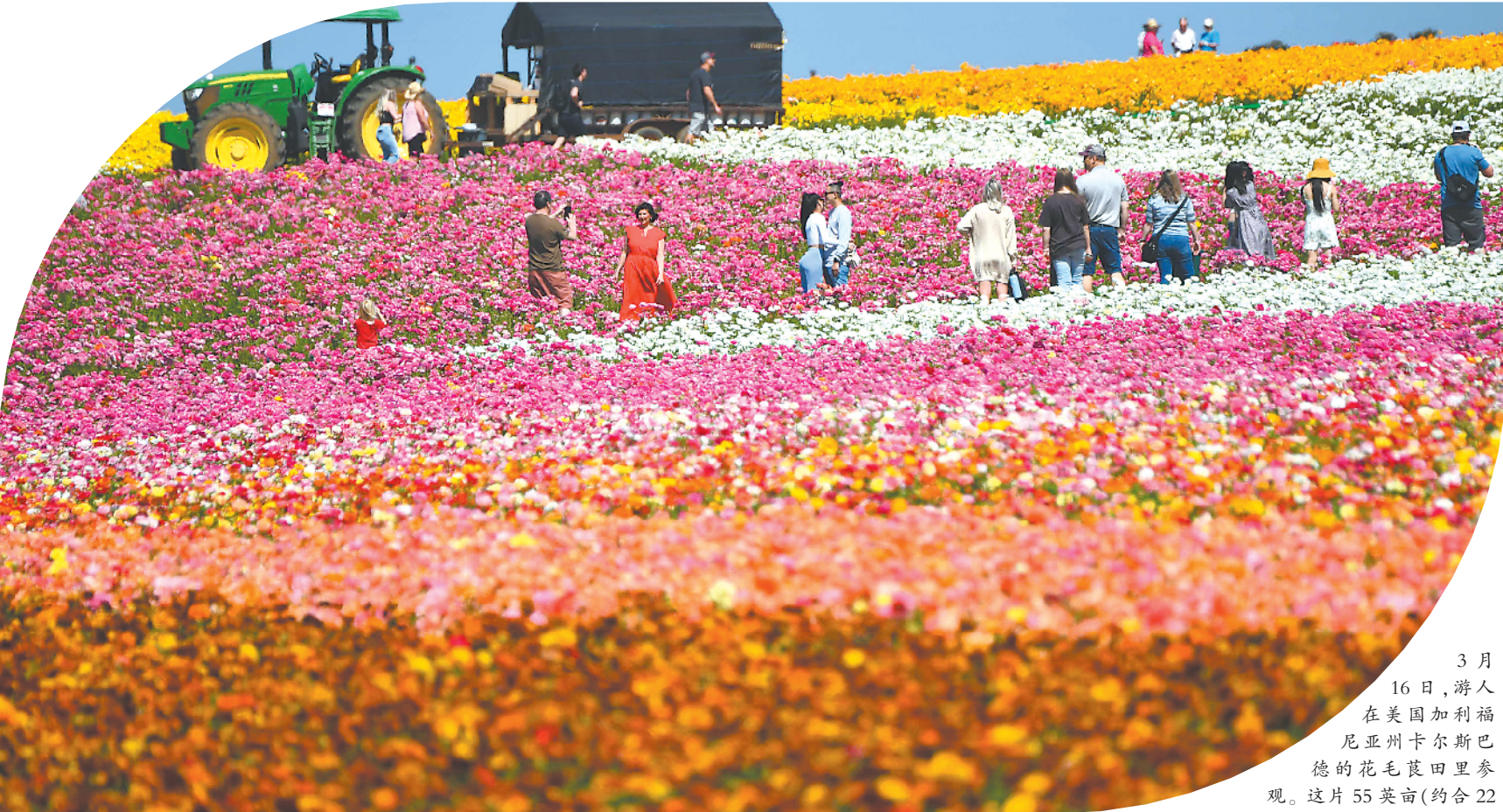
3月16日,游人在美国加利福尼亚州卡尔巴德的花毛茛田里参观。这片55英亩(约合22公顷)的花田中,约7000万朵花毛茛竞相绽放。