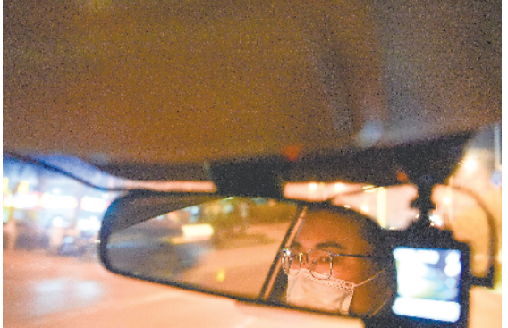
▶ 交警连夜追查非法改装车。