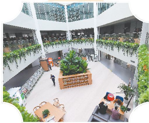
包河区文化艺术馆。