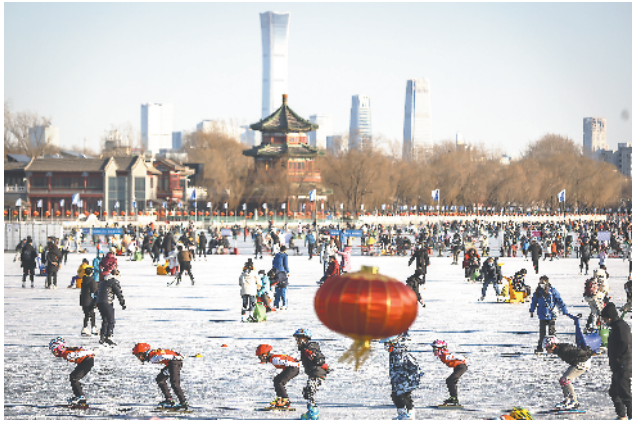
什刹海冰面，人们沉浸在冰雪运动的欢乐中。