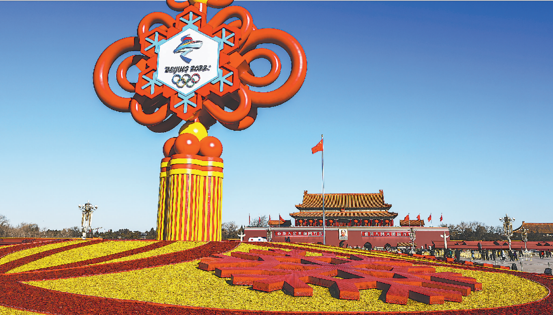
北京天安门广场中心的“精彩冬奥”主题花坛。