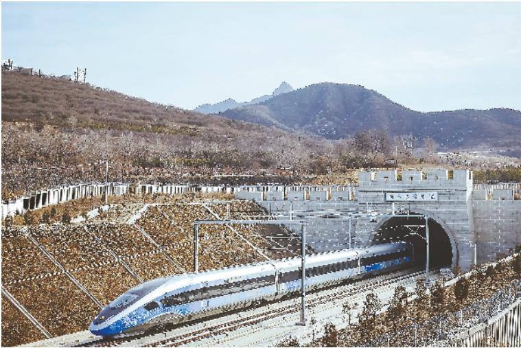
◀ 2月6日上午，一列北京冬奥版复兴号智能动车组经过京张高铁新八达岭隧道。京张高铁是2022北京冬奥会的重要配套工程，为冬奥交通服务提供强有力的运输保障。