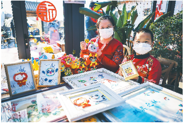
北京市延庆区刘斌堡乡合宿·姚官岭民宿集群，具有冬奥和虎年元素的传统手工艺品深受游客青睐。