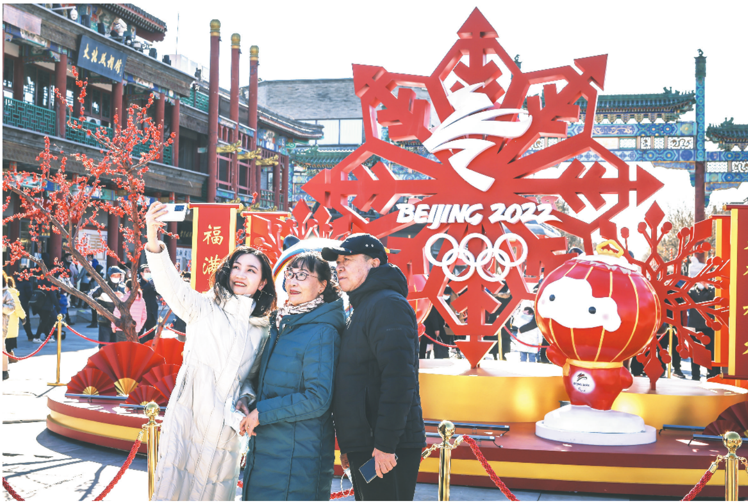
▲ 市民在北京前门大街和冬奥主题景观合影留念。

2月4日晚，举世瞩目的北京2022年冬季奥运会盛大开幕，时隔14年，奥林匹克火炬再次在北京燃起，北京成为全球首个“双奥之城”。北京2008年夏季奥运会的成功举办，丰富了北京的城市底色。如今，北京以浓厚的体育氛围，邀请世界人民共同绘就“一起向未来”的美丽画卷，为奥林匹克留下更为丰硕的冬奥遗产。中国通过筹办冬奥会和推广冬奥运动，让冰雪运动进入寻常百姓家，实现了“带动3亿人参与冰雪运动”的目标，为全球奥林匹克事业作出了新的贡献。春节期间，本报记者走访北京网红天然冰场、漫步北京街头、前往双奥社区……感受“双奥之城”的东方魅力和浓厚的冬奥氛围。