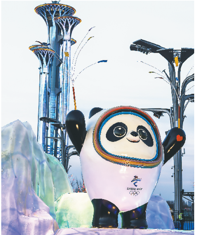
北京奥林匹克公园，憨态可掬的冬奥会吉祥物“冰墩墩”笑迎四海宾朋。