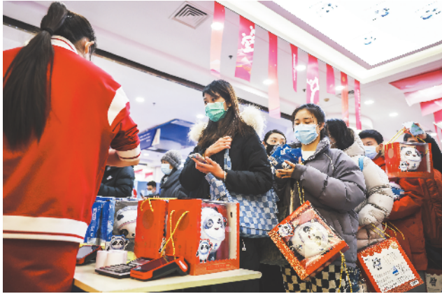
市民在北京2022年冬奥会官方特许商品旗舰店选购商品。