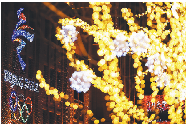
王府井百货大楼上亮起北京冬奥会标识。