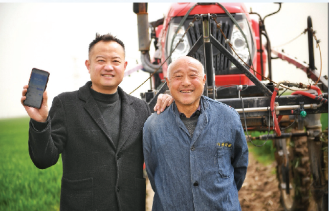
“大山雀”首批使用者。

农业领域的金融服务一直备受关注，也是三农改革的重要内容。去年的中央一号文件就强调坚持为农服务宗旨，持续深化农村金融改革。提出发展农村数字普惠金融。鼓励开发专属金融产品支持新型农业经营主体和农村新产业新业态。但由于农民缺乏抵押和担保，金融机构不够了解农户，无法评定农户的信用情况，导致农村金融一直是行业难题。而卫星遥感信贷技术将天地信息融合，可以有效化解这一难题。