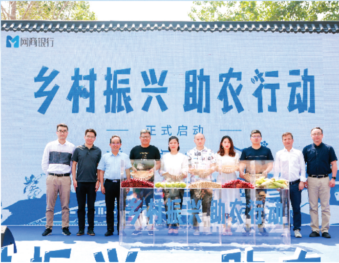
乡村振兴助农行动。

乡村振兴靠产业，也靠人才。今年起，多地政府与网商银行合作，通过数字金融支持政府选拔的带头人，以进一步推动乡村经济发展，助力实现先富帮后富，携手奔小康。目前包括全国十佳农民等在内的数百位“乡村振兴带头人”获得网商银行提供的全年免息数字贷款。