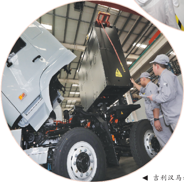
▲ 吉利汉马新能源重卡。