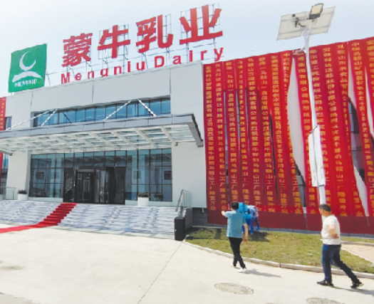
以“标准地”模式出让的蒙牛乳业低温鲜奶项目。

扎实推进全国市域治理现代化试点，完善矛盾纠纷多元化解机制，健全领导干部接访下访、包案化解、阅批群众来信等制度，积极回应群众关切，解决群众诉求，维护群众利益，不断增强人民群众的获得感、幸福感、安全感。