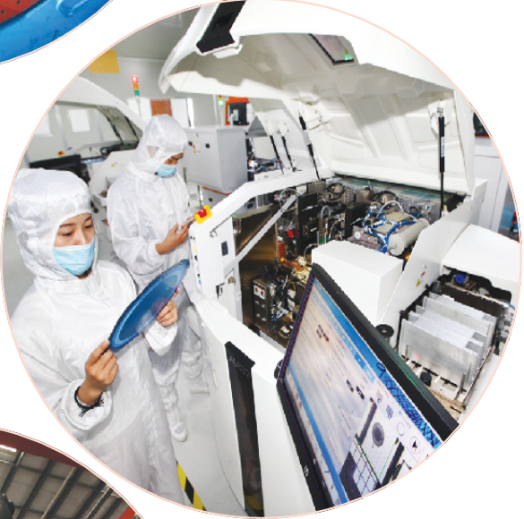
▲ 东科半导体有限公司自主创“芯”全球领先。