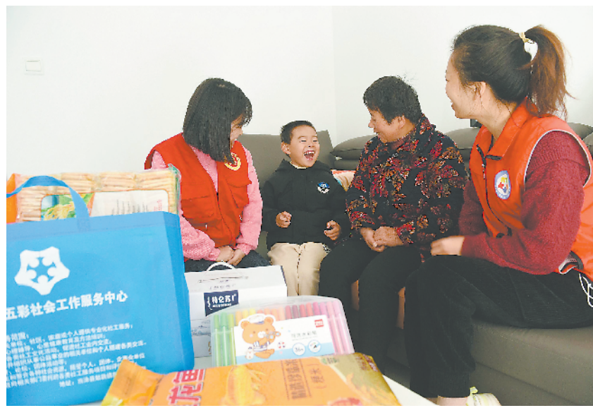
11月28日,马鞍山市民政局、当涂县残联、当涂县五彩社会工作服务中心党支部联合开展“关爱残疾儿童 入户送上温暖”活动,党员志愿者们来到残疾儿童家庭,与残疾儿童互动交流,并送上慰问品。