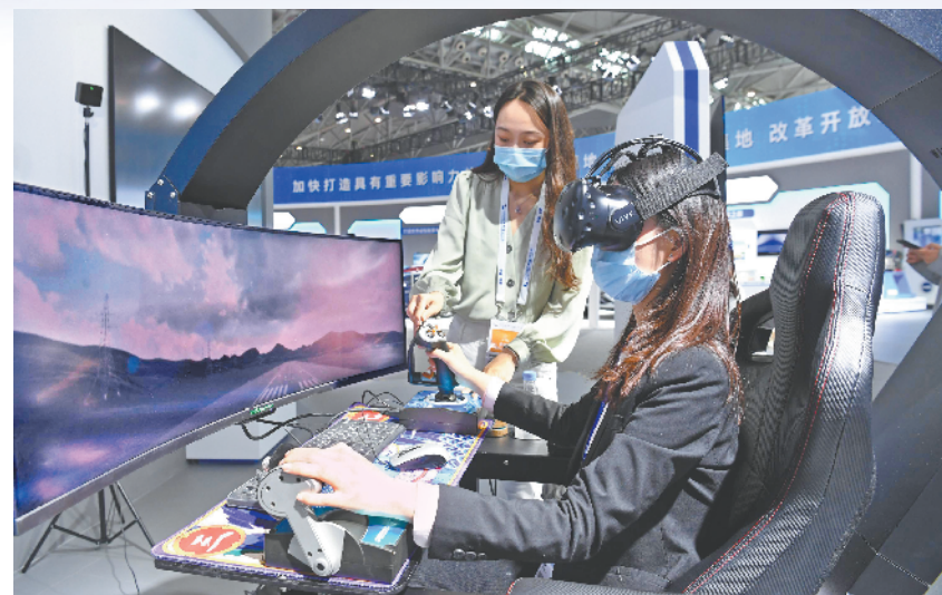
参观者在体验芜湖三七互娱开发的VR游戏《壮志凌云》。