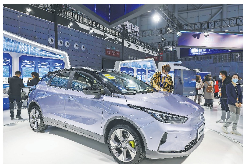
现场展出的吉利新能源汽车。