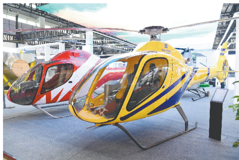
安徽应流集团展出的直升机。