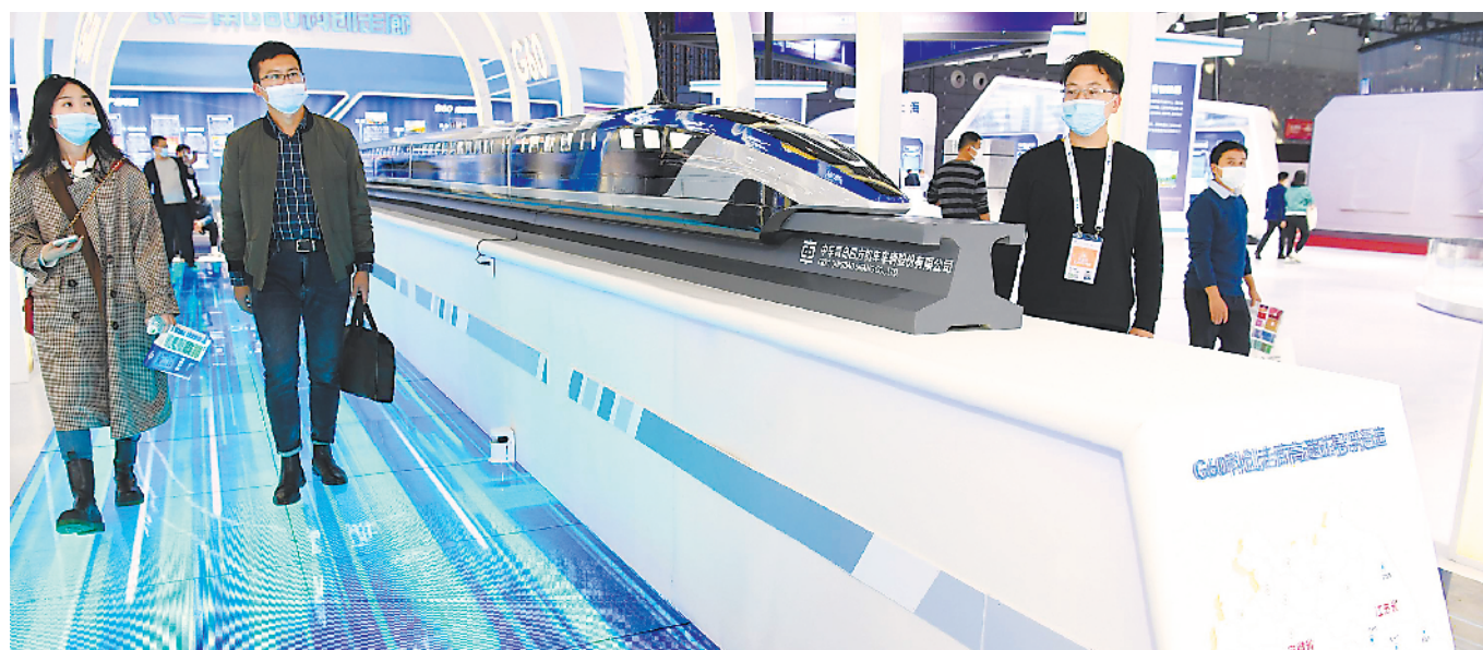
◀ 长三角一体化展区展出的G60科创走廊高速磁悬浮通道。