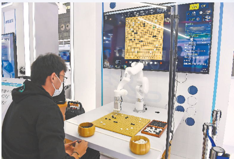
参观者与科大讯飞展出的飞狗弈棋机器人下围棋。