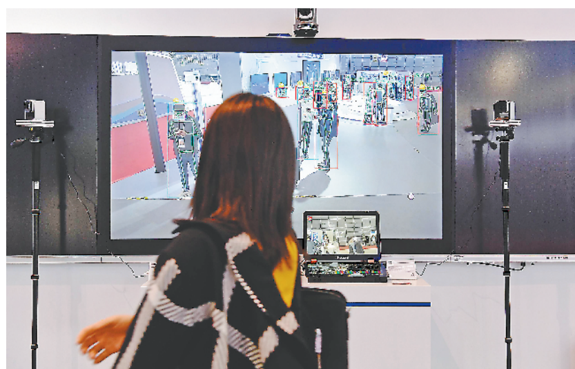
安徽文香科技有限公司展出的行为分析系统吸引市民注意。