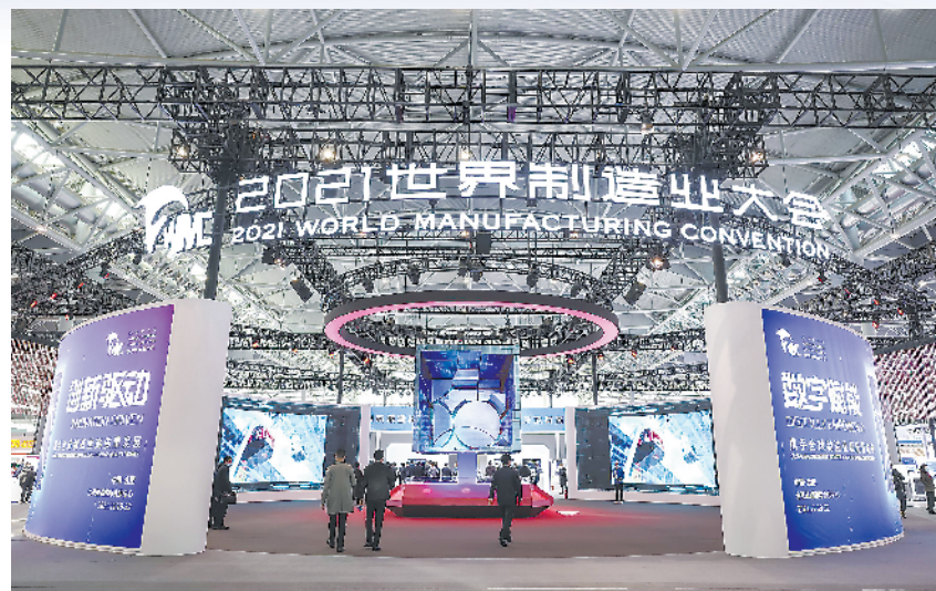
2021世界制造业大会综合会展区序厅。