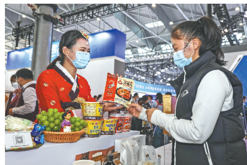
前来参观的市民在韩国馆挑选食品。