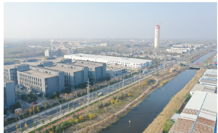
利辛县食品产业园。