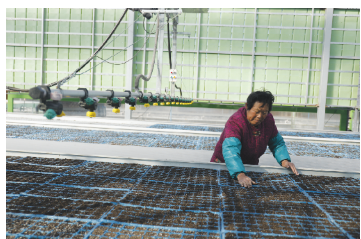
程集镇智慧农业大棚内的中药材育苗。