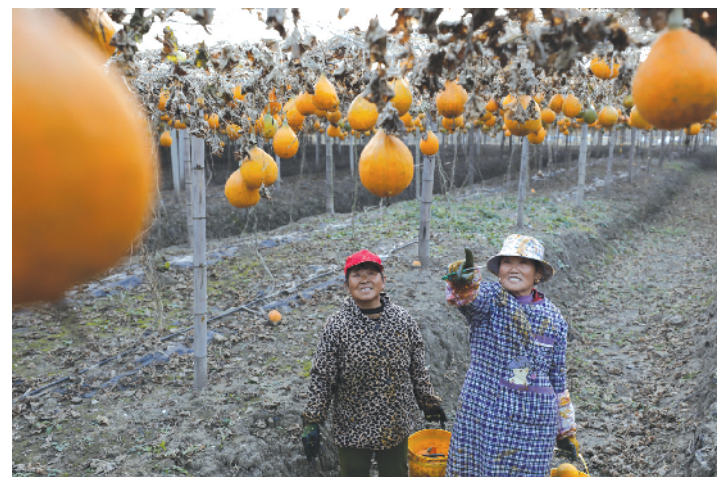
城集镇农业产业园内瓜蒌成熟。