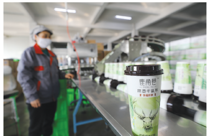
安徽金宜食品有限公司饮品生产线。