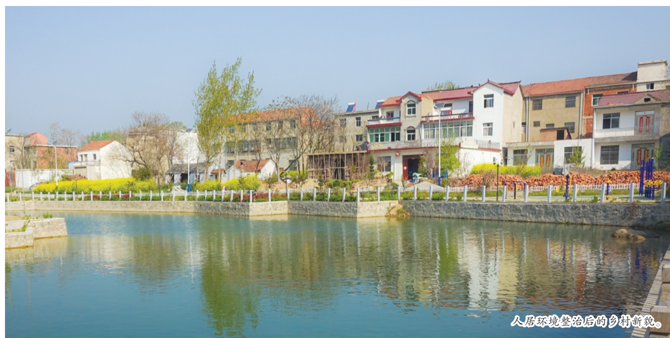
人居环境整治后的乡村新貌。

利辛县轻纺服饰产业起源历史悠久，现已成为利辛产业发展的一张重要名片。生产工艺从纺纱、整浆并、织布，到成衣、床上用品、户外旅游用品等，产品涵盖衣帽服装、纱门纱窗等15个门类，产业链条的完整度、企业的集聚度、产业的集群度在皖北地区乃至安徽省均位于前列。截至2020年底，现有年产值1000万元以上的轻纺服饰类企业207家，其中规模以上企