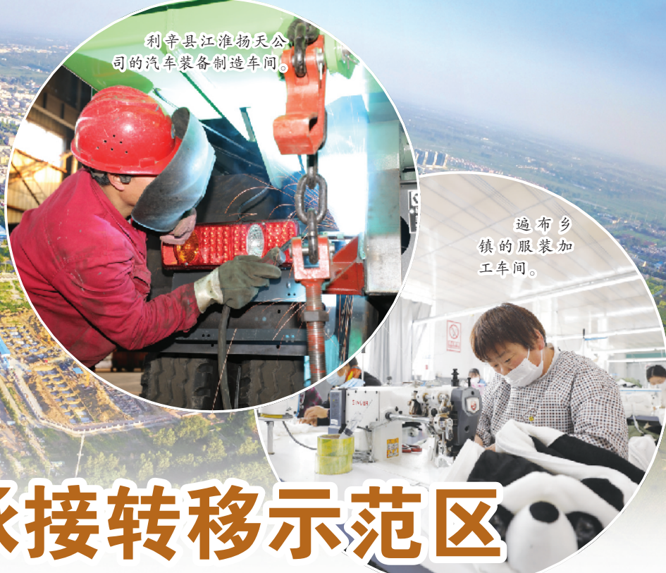
利辛县江淮物天公司的汽车装备制造车间。