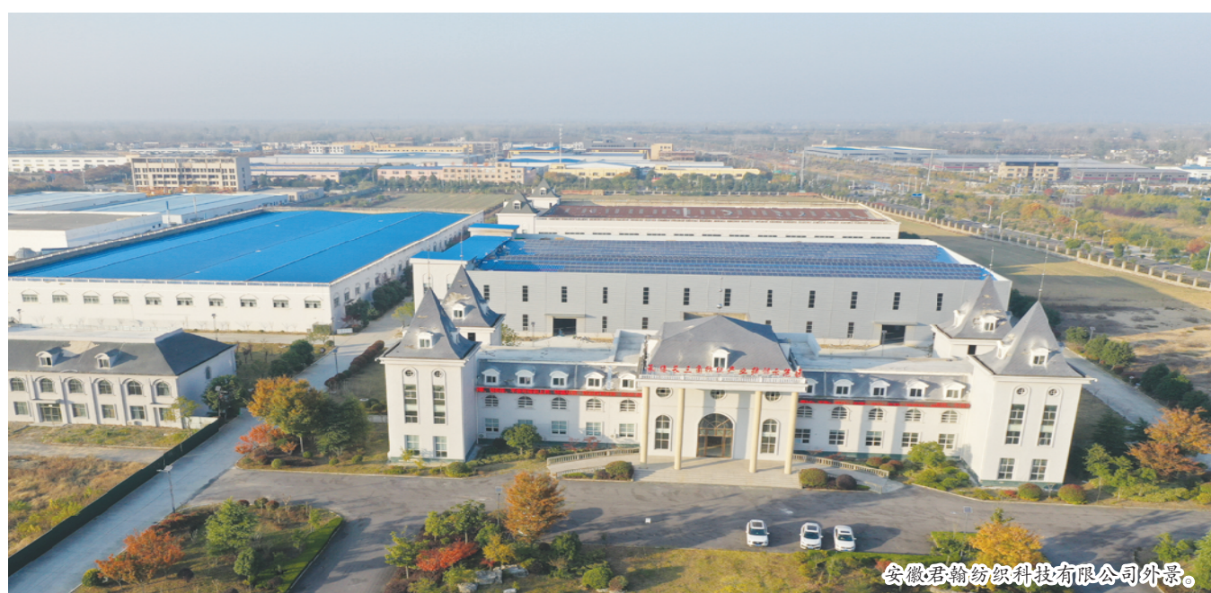
安徽君翰纺织科技有限公司外景。