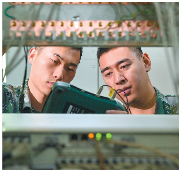
通信中队战士在调试设备。