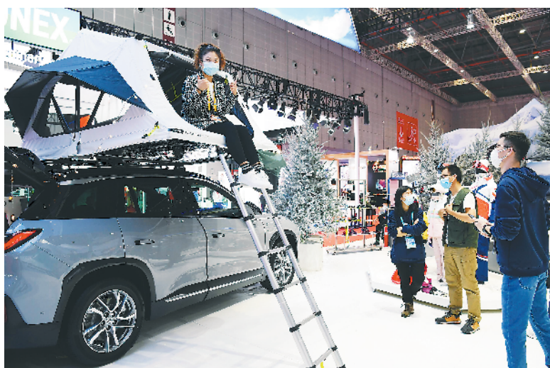
法国迪卡侬全球首发的快开通用双人车顶帐篷引来参观者体验。