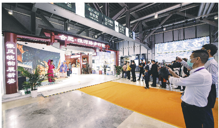
参观者在淮河路步行街展厅观看省黄梅戏剧院演出的黄梅戏。