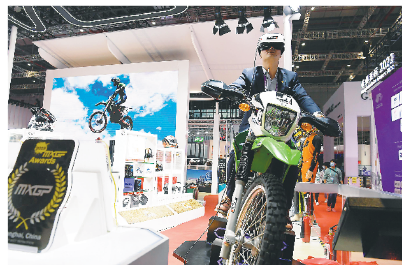
参观者现场感受上海国际越野赛场提供的越野摩托VR体验项目。