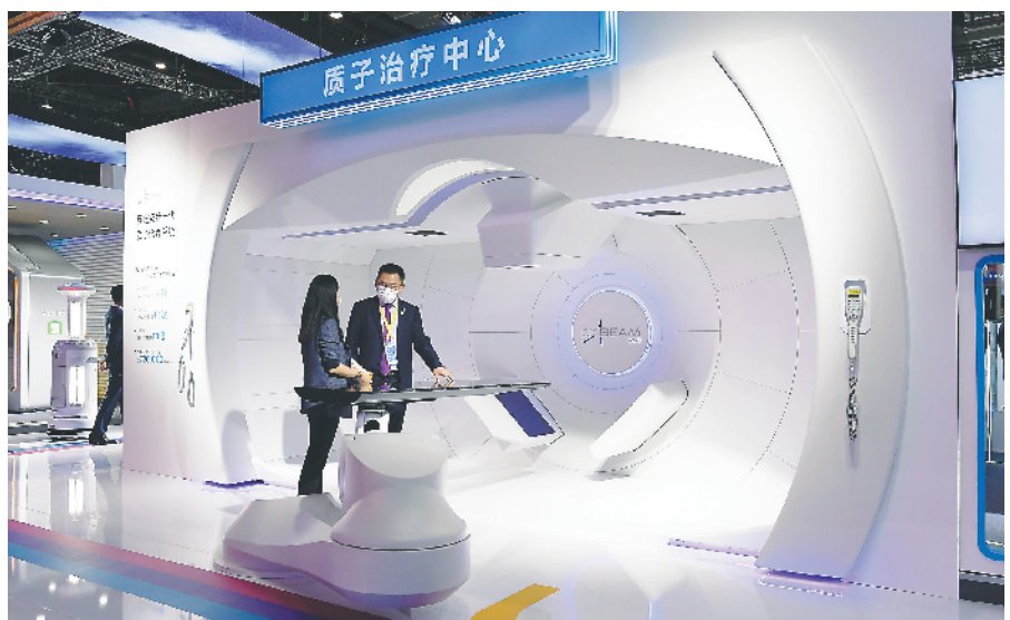
美国瓦里安医疗研发的质子治疗系统。