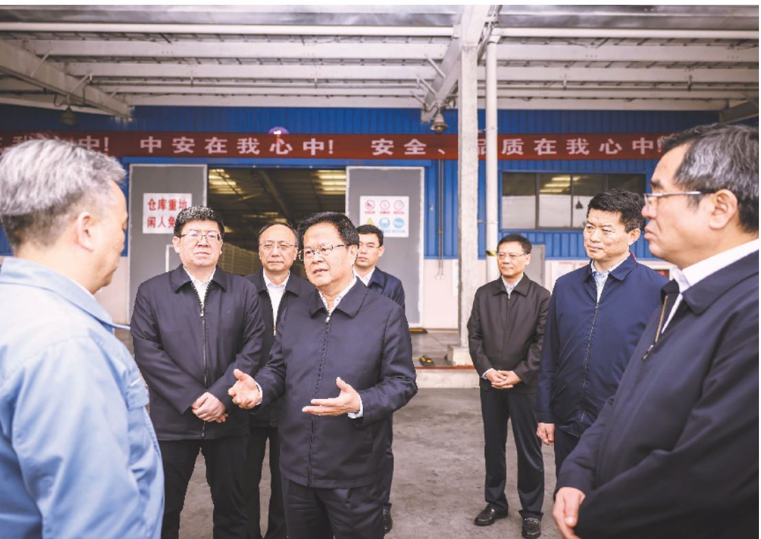
11月4日,省委书记郑栅洁在中安联合煤化公司调研。

本报讯(通讯员 宗永 记者 朱胜利)11月4日,省委书记郑栅洁赴淮南市调研资源型城市转型发展。他强调,要认真贯彻习近平总书记对安徽作出的系列重要讲话指示精神,按照省第十一次党代会部署要求,坚定信心、攻坚克难、奋起直追,下大力气抓招商、上项目、优环境,持续缩小地区、城乡、收入差距,以实干实绩展示新形象新作为。省领导张红文、汪一光陪同。 郑栅洁首先来到中安联合煤化公司,实地了解企业生产经营情况。“产能多少?”“技术水平如何?”郑栅洁问得仔细、听得认真,对企业开展技术创新、抓实党建工作等表示肯定。他勉励企业发挥党建引领作用,建设挖潜提效项目,向高端材料领域延伸,向精细化工领域拓展,做宽拉长产业链,做到吃干榨净。随后,郑栅洁来到淮南平圩发电有限公司,走进发电机组、三期项目集控室、光伏发电远程监控中心,深入了解发电量、煤耗、环保等情况。他指出,要树立大局意识,将能源保供作为重点,挖掘发电能力,为保障全省及长三角电力供应多作贡献。同时要加大技改力度,节约利用资源,提升关键性技术指标,抓好安全生产,促进节能降耗提效。 下午,郑栅洁来到淮南经开区国瑞药业公司,走进展厅了解企业研发、生产、销售情况,得知企业正在研发特医食品。他指出,特医食品关系千家万户,要加快研发生产进度,推市场、做品牌,尽快把量做起来。在田家庵区姚家湾城中村改造和淮河岸线环境综合整治工作项目现场,郑栅洁边听边汇报,详细询问进展情况和困难问题,要求高水平优化城市总体规划 and 控规详规,结合实际按计划分片推进城中村改造,把岸线治理与旧城改造结合起来,实施好淮河岸线生态廊道建设工程,加快补足基础设施短板,不