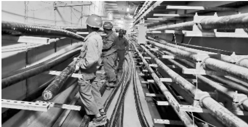
芜湖供电公司员工开展安装工作，助力芜湖南路长江路综合管廊工程建设。

民、商户及重要用户正常供电。截至10月中旬，数十条110千伏线路完成改造或入廊施工，预计工程将于2021年12月底前全面竣工。