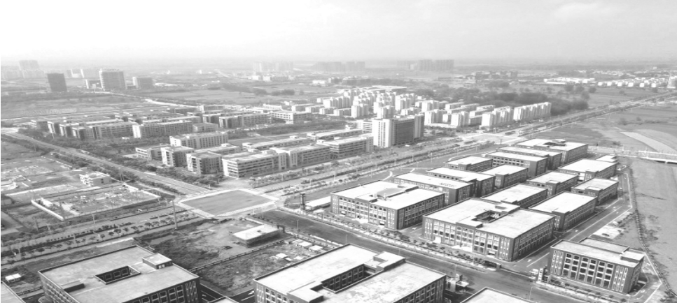
宿马园区智能终端产业园。