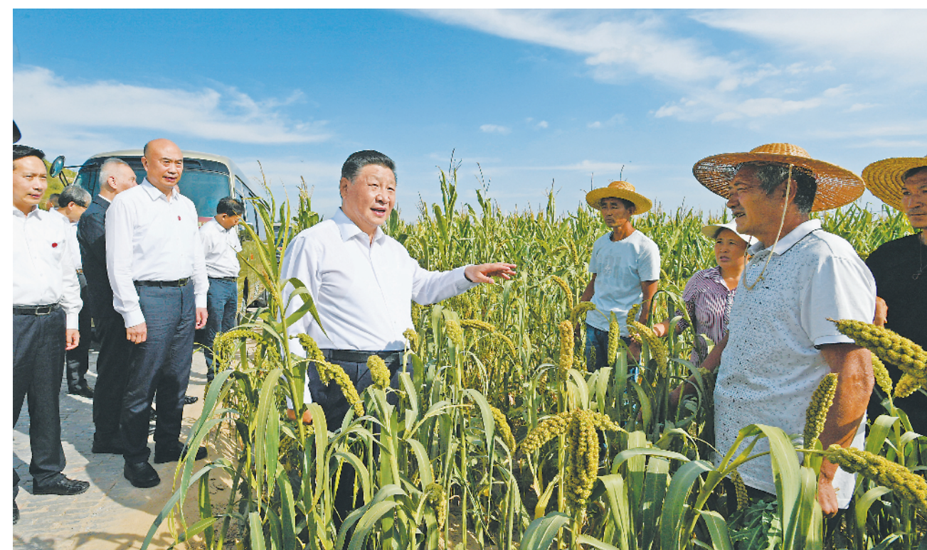
9月13日至14日,中共中央总书记、国家主席、中央军委主席习近平在陕西省榆林市考察。这是13日下午,习近平在米脂县银州街道高西沟村临时下车,察看粮食作物长势,同正在田间劳作的老乡拉家常。