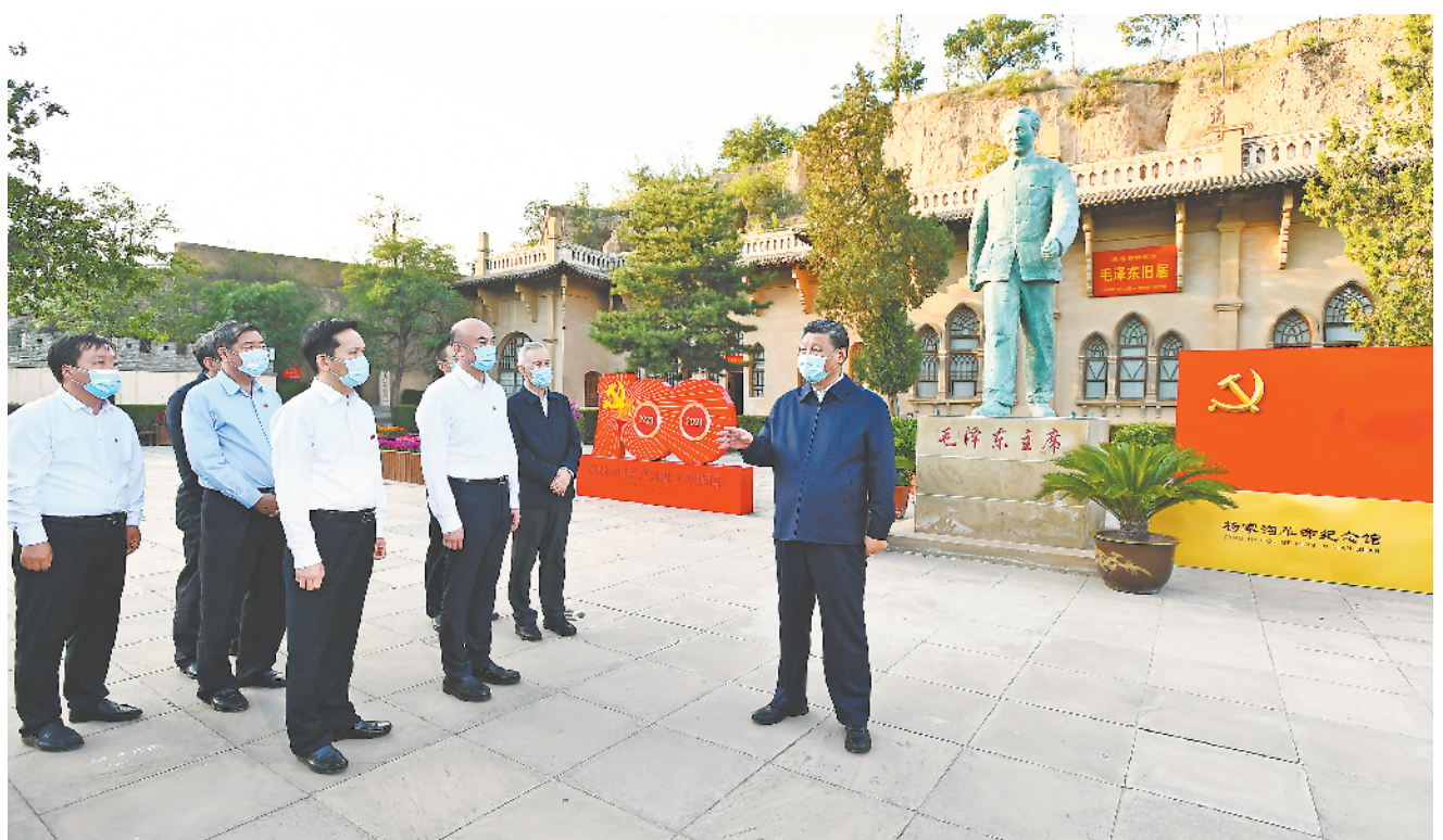
9月13日至14日,中共中央总书记、国家主席、中央军委主席习近平在陕西省榆林市考察。这是13日下午,习近平在米脂县杨家沟革命旧址考察。

■ 要始终坚持和完善党的领导,不断提高党科学执政、民主执政、依法执政水平,充分发挥党总揽全局、协调各方的领导核心作用。要坚持马克思主义基本原理,用马克思主义观察时代、把握时代、引领时代,同时坚持实事求是,从我国实际出发,不断推进马克思主义中国化、时代化