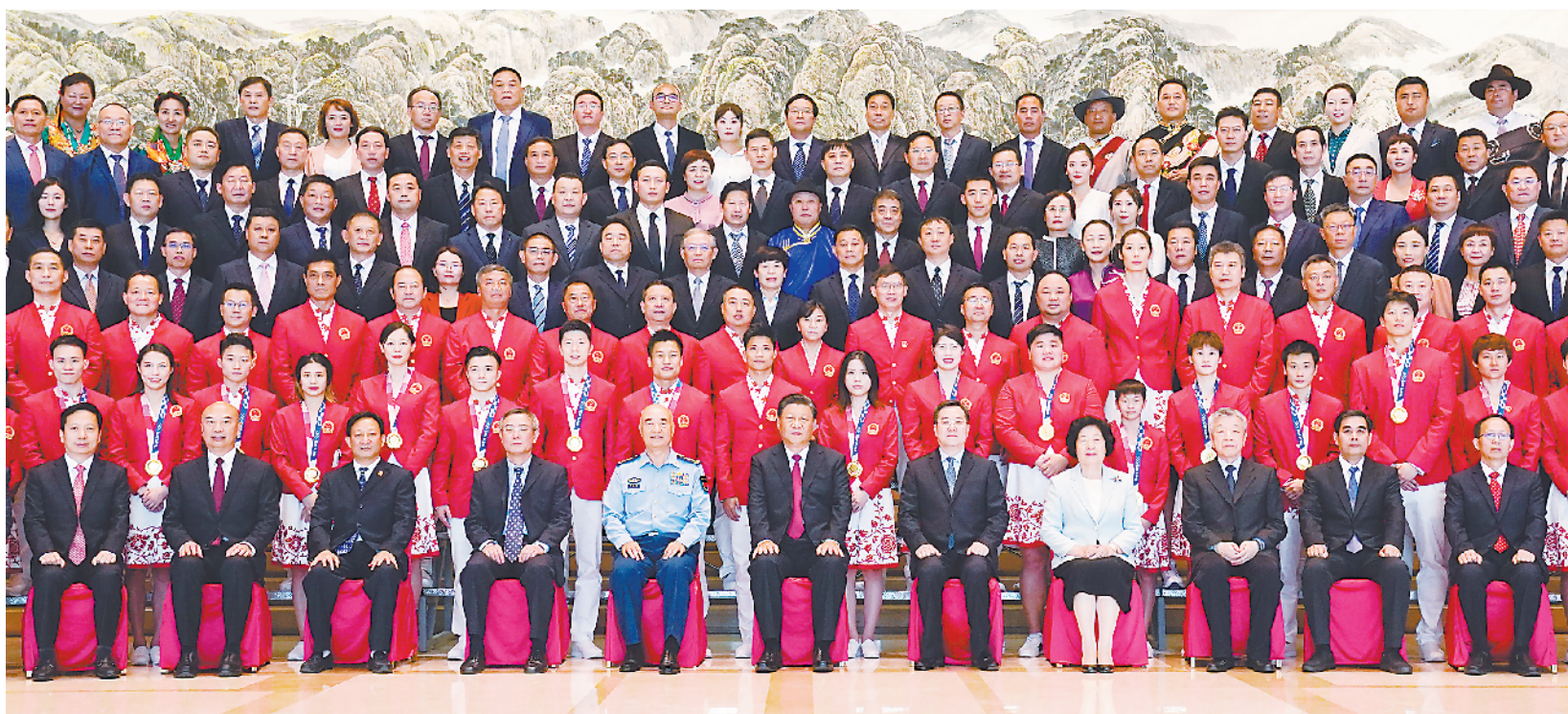
9月15日,中共中央总书记、国家主席、中央军委主席习近平在陕西省西安市亲切会见全国群众体育先进单位、先进个人代表和全国体育系统先进集体、先进工作者代表,东京奥运会中国体育代表团运动员和教练员代表等,并同大家合影留念。

新华社西安9月15日电 中华人民共和国第十四届运动会15日晚在陕西省西安市隆重开幕。中共中央总书记、国家主席、中央军委主席习近平出席开幕式并宣布运动会开幕。15日晚的西安奥体中心体育场灯光璀璨,气氛热烈。19时58分,在欢快的乐曲声中,习近平和夫人彭丽媛等走