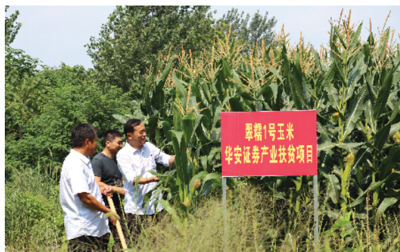
华安证券公司驻村工作队队员查看农作物长势。