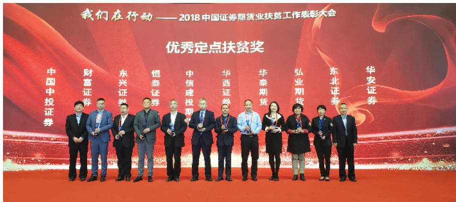
华安证券荣获中国证券业协会“2018年优秀定点扶贫奖”。