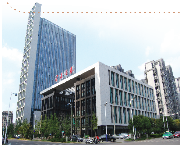
2012年华安证券整体迁入新大楼。

水无常形,兵无常势。物竞天择,适者生存。“十四五”期间,我们将顺“天时”,抢抓产业结构升级、金融体系重塑和资本市场改革的历史机遇,加快业务转型创新,着力打造服务新兴产业的创新型投行、服务大众理财的专业财富管理两大品牌;借“地利”,用好安徽科技创新策源地优势、“左右逢源”的区位优势和公司网点优势,在服务长三角区域一体化、京津冀协同发展、粤港澳大湾区建设等国家战略中实现更大作为;促“人和”,营造良好的内外部生态,坚持内生增长的同时寻求外延发展,坚持自身的同时促进共享发展,统筹兼顾公司与股东、员工、客户、政府及社会等利益相关方利益,建设和谐发展的新样板。