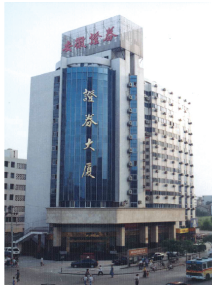
华安证券前身——安徽省证券公司。

所幸,在省委、省政府支持下,华安证券通过中央专项财政借款注资才渡过难关。2006年-2009年,公司抢抓股权分置改革带来的发展机遇,自我消化,偿还巨额债务,爬过低谷,终见曙光。2009年,公司与所有坚守的员工一起偿清了专项借款,改变了资不抵债的状况,重起新征程,召开第一次党员代表大会,选举产生新一届党委班子,在党的领导下进入深化改革、创新发展的全新阶段。