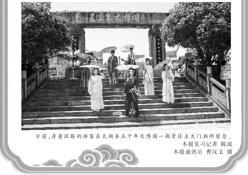
日前，身着汉服的游客在太湖县五千年文博园一期景区主大门拍照留念。

五千年文博园是以中华文化为主题的公园，国家 4A 级旅游景区，占地 1200 亩，由“一梦千年”“十里画廊”两个景区组成，园内建有五千年文化长廊、五千年文化根雕园、四大名著文化园、黄梅戏艺术街、华夏爱情文化园等百座人文景点。徽派建筑与江南园林、传统文化与现代科技在这里相映成趣，令人目不暇接。 五千年文博园投资有限公司总经理何静介绍，从今年“五一”起，文博园一期“一梦千