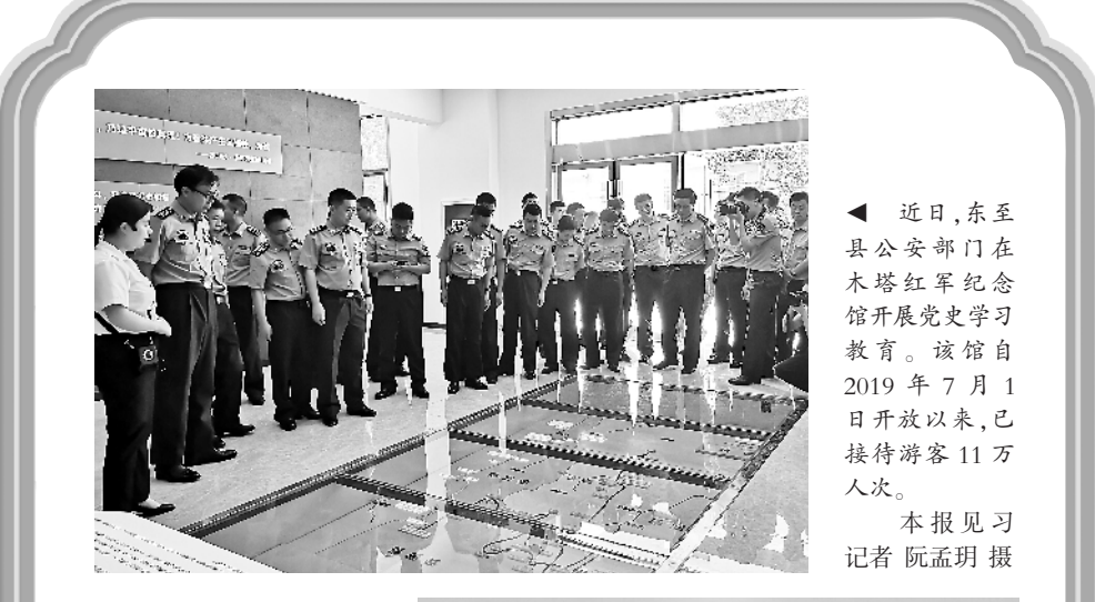
近日，东至县公安部门在木塔红军纪念馆开展党史学习教育。该馆自 2019 年 7 月 1 日开放以来，已接待游客 11 万人次。

约景区，‘五一’小长假以来，姚村镇接待游客约 5500 人次，其中大部分为周边市县的自驾游客。” 近年来，郎溪县紧抓“一地六县”发展机遇，依托独特的山水资源、特色资源、品牌资源，发展休闲农业和乡村旅游，推出许多有质量、有竞争力的文化旅游产品，积极打造长三角区域休闲度假旅游目的地。 在涛城镇的大佛山养心谷，300 余亩的黄茶顺着丘陵起伏绵延，健身步道、木亭与茶园相映成趣。“茶山上空气好，景色优美，我们一家都来了，还能用土锅烧饭，可真香。”来自溧阳的游客陈增光说。“2020 年养心谷推进二期建设，完善道路、栅栏、小木屋基础设施，新建成了农耕文化展示馆和红色革命纪念馆，还入选安徽省首届十大最美茶旅游线路。”大佛山旅游开发公司总经理张建国介绍。 郎溪县文化和旅游局副局长姜长志告诉记者，随着“一地六县”旅游的深化发展，郎溪的旅游路线越来越多地出现在周边地区游客的出行“菜单”上。