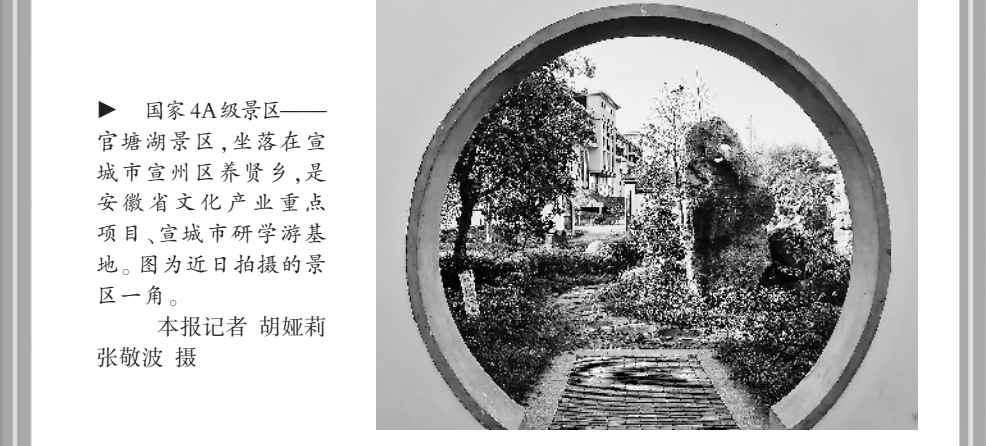
国家 4A 级景区——官塘湖景区，坐落在宣城市宣州区养贤乡，是安徽省文化产业重点项目、宣城市研学游基地。图为近日拍摄的景区一角。

假区外部通达性、运营管理及信息化建设等 106 项工作任务。目前，度假区以“乡村田园”为主题资源，以“慢行江南阡陌·乐活田园梦乡”为主题形象，以打造安徽省著名乡村体验地、长三角精品田园慢谷度假区、国家级旅游度假区为发展目标，推出了繁昌窑龙窑遗址展示馆、中分村红色教育基地、八分村美丽乡村、春谷水云间度假酒店、途居马仁山房车露营地、马仁奇峰 4A 级景区等一批优质旅游产品。其中，依山傍水而建，镶嵌在万亩竹林林海间的途居马仁山露营地是奇瑞集团途居露营地旗下的第八个直营露营地，今年“五一”试运营期间，营地对外开放 45 辆房车，吸引了近 3000 人前来度假。繁昌窑龙窑遗址展示馆也在“五一”对游人开放，展览以“泥火之恋·青白流光”为题，展示了繁昌窑青白瓷的历史文化和独特风采。 据了解，繁昌慢谷创建国家旅游度假区已通过专家基础评价，进入迎检验收阶段。这将为打造“欢乐芜湖”文旅品牌、拓展江城“欢乐地图”增添亮色。