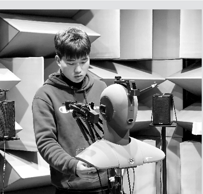
▲ 在宿州市高新区华瑞赛维(宿州)科技有限公司实验室内,工作人员对国内一线品牌的手机5G信号强弱做检测。

为积极开拓“一带一路”沿线国际市场,帮助企业用好用足优惠政策,安庆海关加强与地方商务部门联合宣传,形成合力,提高覆盖面;大力推行“无纸化”申报、网上免费申报平台、智能审核、自助打印原产地证书,对符合条件的企业实行“信用签证”,做到“足不出户”即可申请原产地证书;建立和完善国外退税查询机制,强化人员业务培训,支持企业扩大出口,提高企业对优惠原产地证书的利用率。