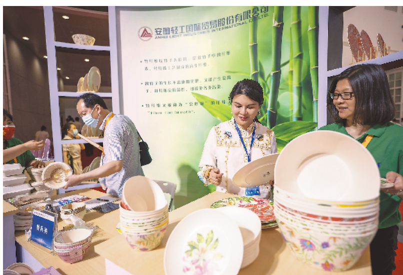
▲ 安徽轻工国际贸易股份有限公司展示的可降解餐具。