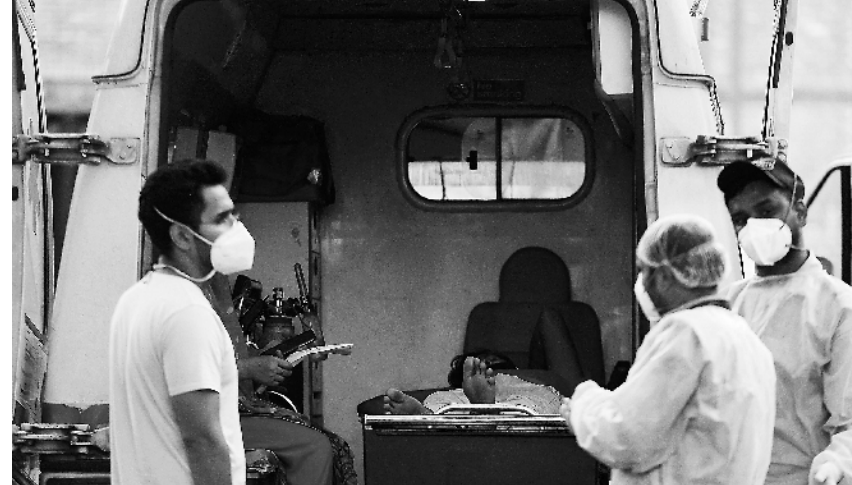
5月1日，新冠患者乘救护车抵达印度新德里的一家医院等待被接收。印度首都新德里首席部长凯杰里瓦尔5月1日宣布，新德里目前正在实施的“封城”措施将延长一周至10日5时。这是新德里第二次延长“封城”措施。