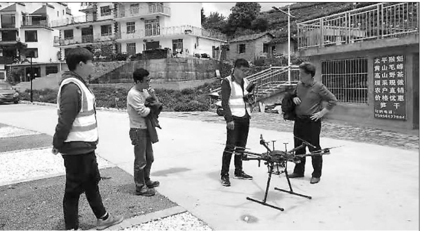
4月27日，黄山市黄山区委托第三方技术服务机构为制定水土保持方案开展外业测绘。

连日来，黄山市及黄山区整改工作专班对太平湖区域存在的生态环境突出问题进行“大起底”，开展太平湖湿地公园和风景区范围线技术核定工作，现场摸排查看沿湖项目建设情况、损坏岸坡情况，分类梳理汇总，建立问题清单，按照“一项目一对策”“一地块一措施”要求，按时按质按量推进整改落实。