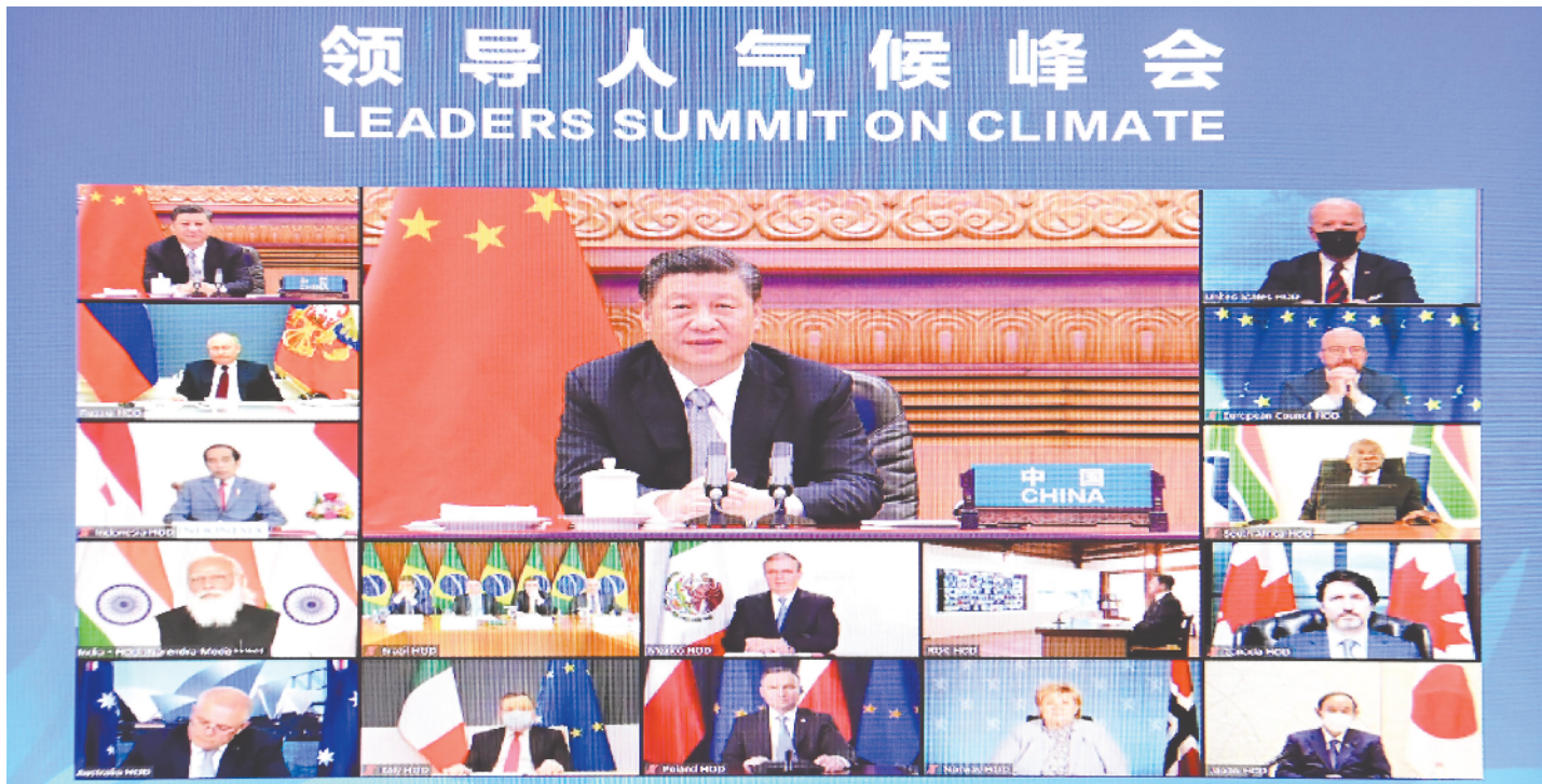
4月22日晚,应美国总统拜登邀请,国家主席习近平在北京以视频方式出席领导人气候峰会,并发表题为《共同构建人与自然生命共同体》的重要讲话。

气候变化给人类生存和发展带来严峻挑战。面对全球环境治理前所未有的困难,国际社会要以前所未有的雄心和行动,共商应对气候变化挑战之策,共谋人与自然和谐共生之道,勇于担当,勠力同心,共同构建人与自然生命共同体 作为全球生态文明建设的参与者、贡献者、引领者,中国坚定践行多边主义,努力推动构建公平合理、合作共赢的全球环境治理体系。中方将在今年10月承办《生物多样性公约》第十五次缔约方大会,同各方一道推动全球生物多样性治理迈上新台阶。中方通过多种形式的南南务实合作,帮助发展中国家提高应对气候变化能力。中方还将生态文明领域合作作为共建“一带一路”重点内容,持续造福参与共建“一带一路”的各国人民