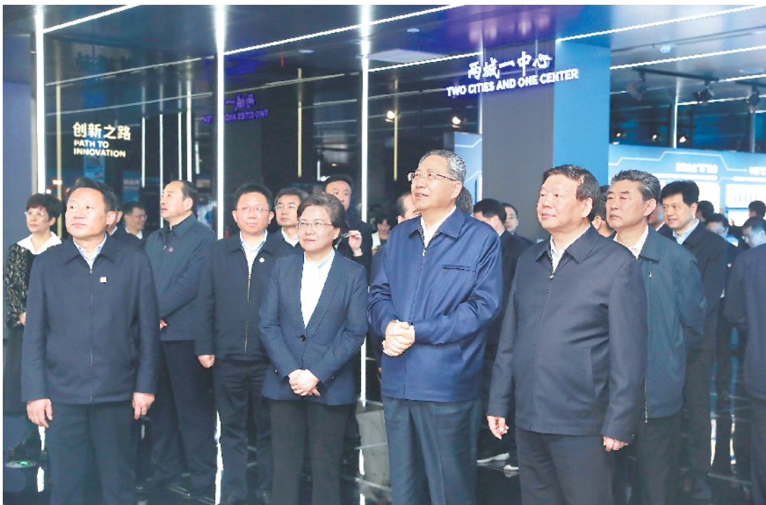
4月22日下午,省委书记李锦斌率安徽省党政代表团在江苏省委书记娄勤俭陪同下,考察南京市江北新区规划展览馆,了解江北新区规划建设最新进展、南京市与安徽省毗邻地区跨界合作发展规划布局 and 重大基础设施工程建设情况。