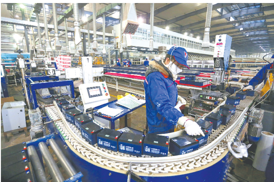
4月20日，界首市田营循环经济产业园，工作人员正在检测生产的新电池。

近年来，合肥在科技创新之路上迈出坚实的步伐，结出累累果实。其中，在“量子”领域取得的成果，为这座蒸蒸日上之城都添上了浓墨重彩的一笔。