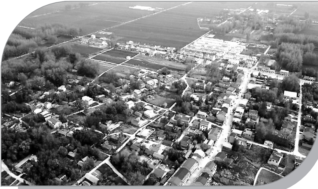
◀ 位于肥东县的合肥东部新城核心区处处绿意盎然、风景如画。近年来,该区坚持规划建设高标准、高要求,着力打造更加靓丽宜居的现代化新城。图为合肥东部新城核心区的美景。