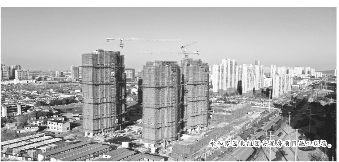
永和家园北组团安置房项目施工现场。