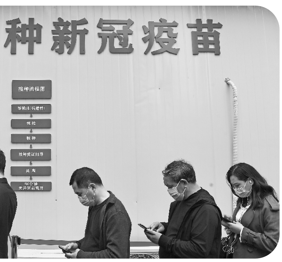
4月8日,市民在重庆江北观音桥商圈的“方舱接种点”排队等待接种新冠疫苗。当日,位于重庆市江北区观音桥商圈的新冠疫苗方舱接种点正式启用。