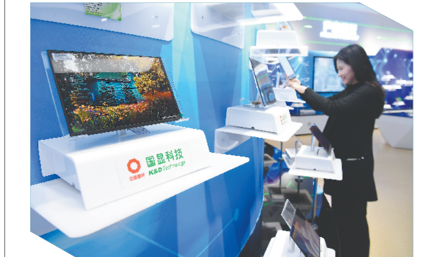
▲ 3月29日拍摄的蚌埠国显科技有限公司生产的各类液晶显示屏。

近日,省政府新闻办分别在蚌埠、芜湖、合肥举行安徽自贸试验区建设情况新闻发布会,全方位介绍安徽自贸试验区高质量推进各项建设的情况。 2020年9月24日,安徽自贸试验区正式揭牌运营,实施范围119.86平方公里,涵盖合肥、芜湖、蚌埠三个片区。自贸试验区以制度创新为核心,以可复制可推广为基本要求,全面落实中央深入实施创新驱动发展、推动长三角区域一体化发展战略,发挥在“一带一路”建设和长江经济带发展中的重要节点作用,推动科技创新和实体经济深度融合,加快推进科技创新策源地建设、先进制造业和战略性新兴产业集聚发展。截至今年2月底,区内新设立企业3999家,协议引资额3195亿元。