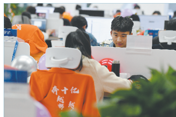
4月1日,位于合肥的梵海进出口贸易有限公司,员工在办理跨境电商业务。