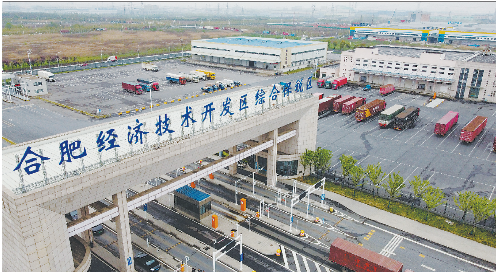
▲ 4月1日拍摄的合肥经济技术开发区综合保税区。该区已引进联宝科技等26家电子信息及配套企业、考拉海购等30家跨境电商关联企业。

度不超过日均50万桶。声明说,在主要经济体的新冠疫苗接种计划和刺激方案支持下,世界能源市场有所改善,但欧佩克与非欧佩克产油国注意到,近几周出现的波动需要成员国继续采取谨慎的方法来监测市场发展。根据欧佩克官方网站公布的各国产量配额计算,欧佩克与非欧佩克产油国5月将每日增加35万桶,6月增产幅度与5月相同,7月产量每日增加44.1万桶。