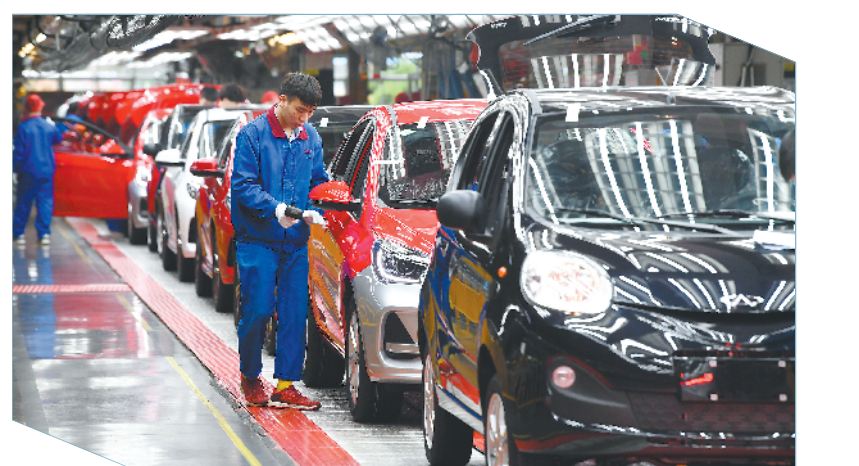
▶ 3月31日,芜湖奇瑞汽车总装车间员工在组装汽车。奇瑞集团业务范围遍布海外80余个国家和地区。