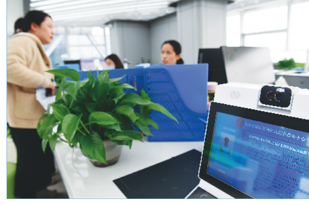
3月30日,市民在芜湖自贸试验区综合服务中心办理业务。该中心于1月试运行,可实现一窗通办自贸试验区所有行政审批事项。