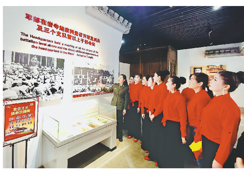
3月26日，黄山市民在岩寺新四军军部旧址纪念馆参观。

一座高达67米的明代古塔，这便是皖南一带有名的文峰塔。塔的南侧建有凤山台，因当年新四军曾在这里进行阅兵点验，当地人将其称为“点将台”。1938年4月28日，新四军召开排以上干部东进抗日誓师大会，并组成由粟裕任司令员的抗日先遣队奔赴前线，揭开新四军东进抗日的序幕。5月，新四军军部及主力陆续向抗日前线进发，成为世界反法西斯队伍中的一支重要力量，被人民群众誉为“铁军”。