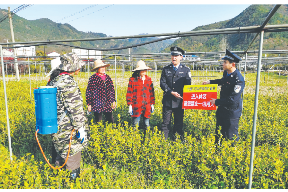
3月24日，怀宁县茶岭镇联合村森林防火队员在巡山。清明将至，该队把做好森林防火工作作为当前头等大事来抓，广泛宣传，加大巡查力度，严控火源，全力筑牢森林防火“安全线”。

从风起云涌的创新实践到波澜壮阔的改革攻坚；从综合实力实现大赶超到民生福祉得到大改善；从全国文明城市首首首成到三大攻坚战连战连捷……宿州改革发展每一步进程中，《拂晓报》既是宿州沧桑巨变的重要见证者、记录者，也是宿州发展历程的重要参与者、建设者。 “今年是建党100周年，为了更好地纪念革命先烈，传承红色基因，我们正面向社会广泛征集报史资料，积极筹建《拂晓报》报史馆。”武华峰表示，“作为新时代的新闻人，我们会把理想信念的火种、红色传统的基因一代代传下去，推动党的新闻事业薪火相传、血脉永续。”