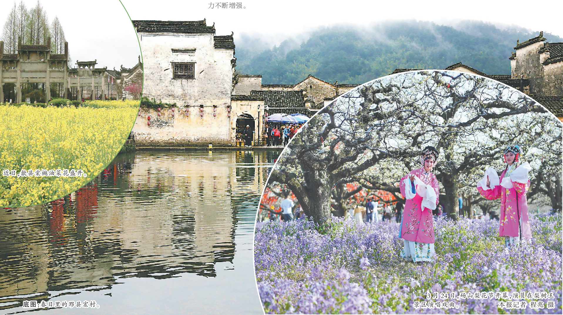
近日，歙县棠樾油菜花盛开。

春风拂面，正是赏花好时节。3月22日，2021年亳州乡村旅游暨龙扬第七届梨花节在龙扬镇苏赵百年梨园开幕。梨花节主题为“最美绚烂梨花 绿色生态龙扬”，由龙扬镇政府主办，活动为期一周。梨花节期间，主办方为游客准备了精彩的文艺演出，包括戏曲、舞蹈、小品、歌曲等，并举办特色农产品展销、茶艺品鉴等活动。梨花节开幕当天，现场参与人数达 4000 余人，线上直播观看人数近 20 万人。通过挖掘梨文化内涵，打造梨花节，龙扬镇已经成为备受周边城乡群众青睐的赏花踏青目的地之一。（戴明）