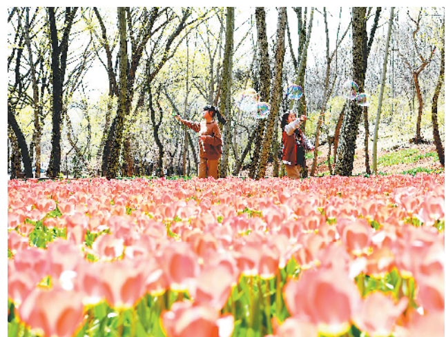
3月23日，淮南市八公山风景区内，春游的学生在郁金香花海中玩乐，享受春光。

除了赏花线路，安徽还有一些春日赏花经典景区。淮北黄里杏花谷淡雅清丽，淮南八公山梨树银光闪闪，蚌埠花博园郁金香五彩斑斓，阜阳生态乐园满园春色关不住，凤阳岗村千亩油菜花装扮希望的田野。