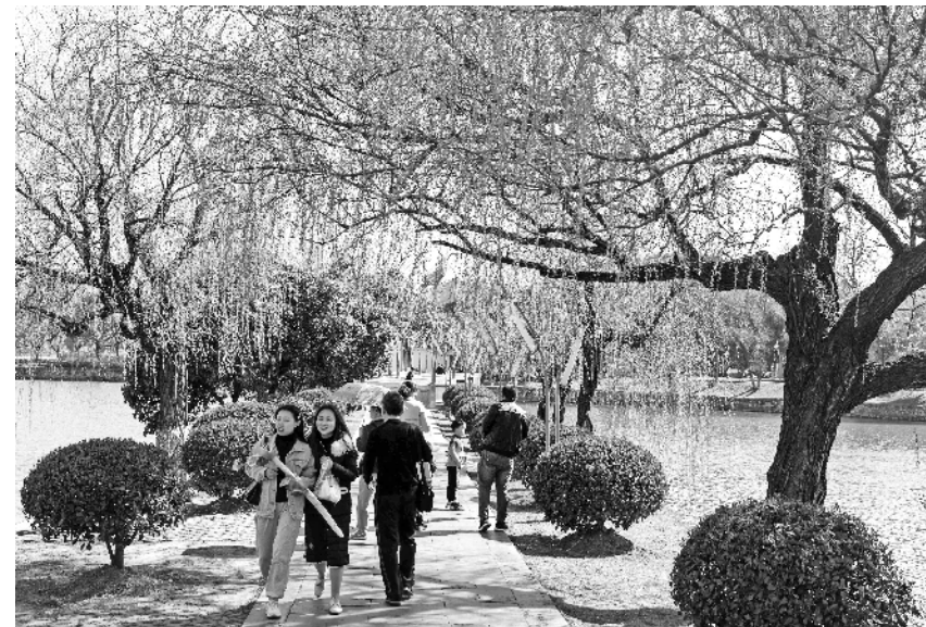
连日来，铜陵市风和日丽。图为天井湖公园中杨柳依依，抽芽泛绿，呈现出“碧玉妆成一树高，万条垂下绿丝绦”的诗情画意，吸引着众多市民游园观光。

据了解，黄山市春节期间消费品市场货丰价稳，市场运行总体平稳有序。其中，该市商务部门重点监测的18家重点零售和餐饮企业，春节假期实现营业额达3275.32万元，同比增长14.95%。