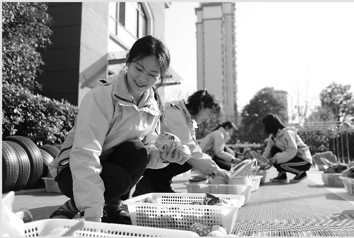
2月19日，合肥市琥珀名城和幼儿园的老师们将园内玩具整理、归类、晾晒。