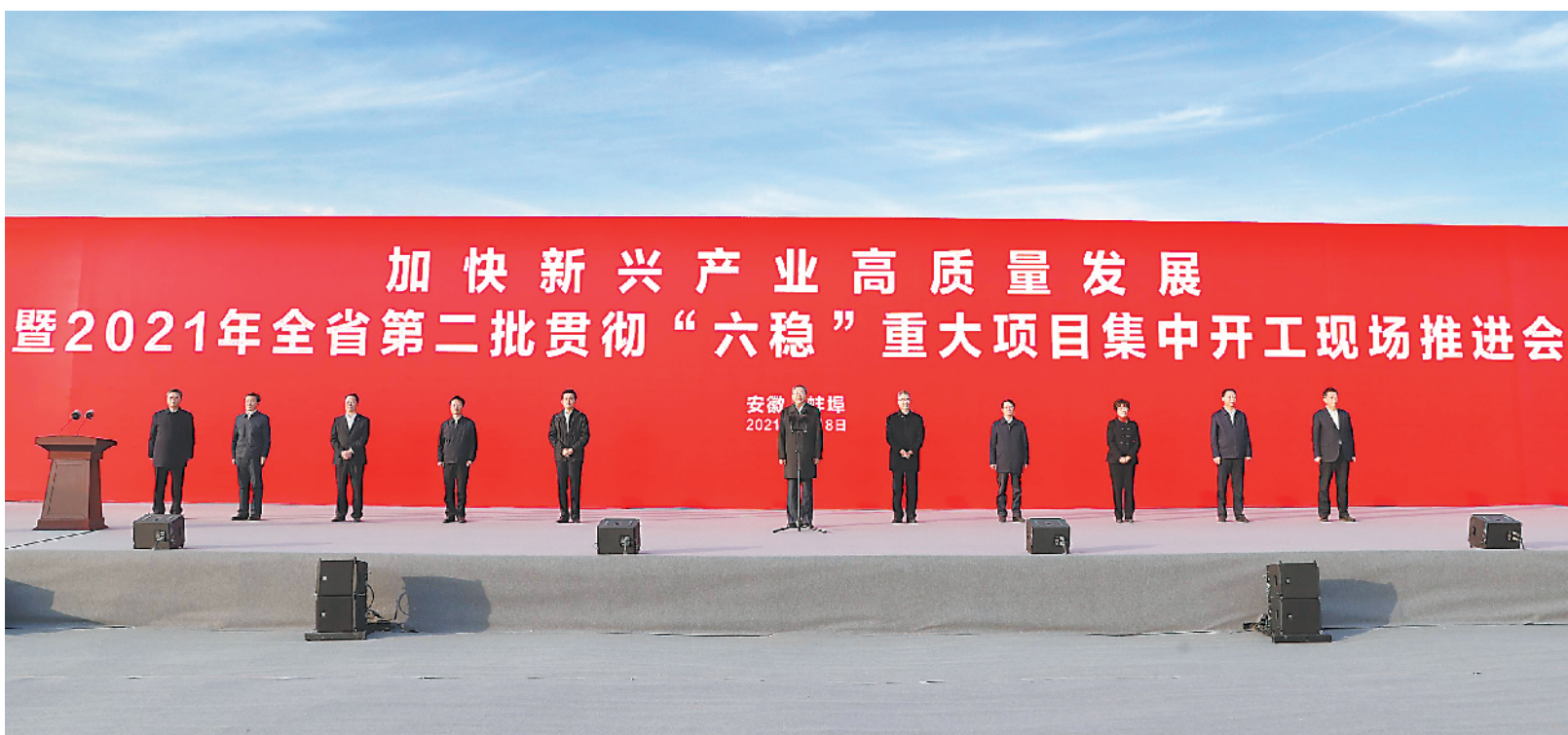
2月18日下午,加快新兴产业高质量发展暨2021年全省第二批贯彻“六稳”重大项目集中开工现场推进会在蚌埠市举行。