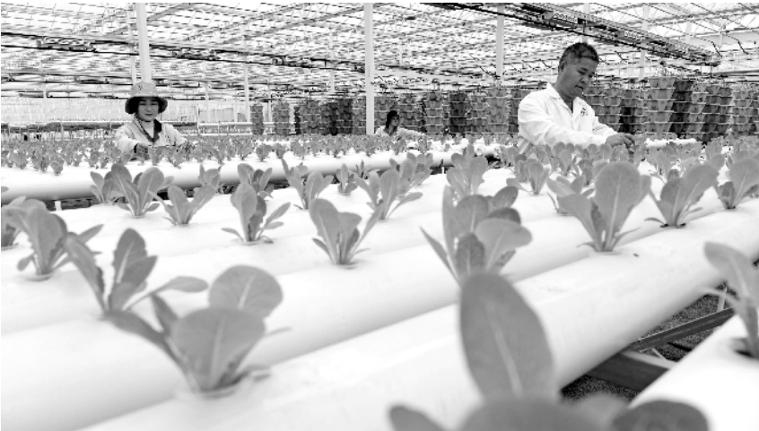
2月7日,淮南市凤台现代农业科技示范园,安徽省来绿港智慧农业科技发展有限公司员工在移植草莓新品种。该示范园目前建成智能玻璃温室28万平方米,带动周边400余名群众就业增收。

近日,国家邮政局党建工作领导小组办公室、共青团中央维护青少年权益部联合开展2021年“快递从业青年服务月”活动。活动期间,相关部门将深入快递企业和从业青年群体开展宣讲活动,把倾听诉求、政策宣讲、释疑解惑和思想引导融为一体,帮助从业青年把个人成长融入全面建设社会主义现代化国家新征程。