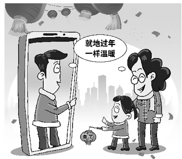
“就地过年”也温暖! 甘尧/绘