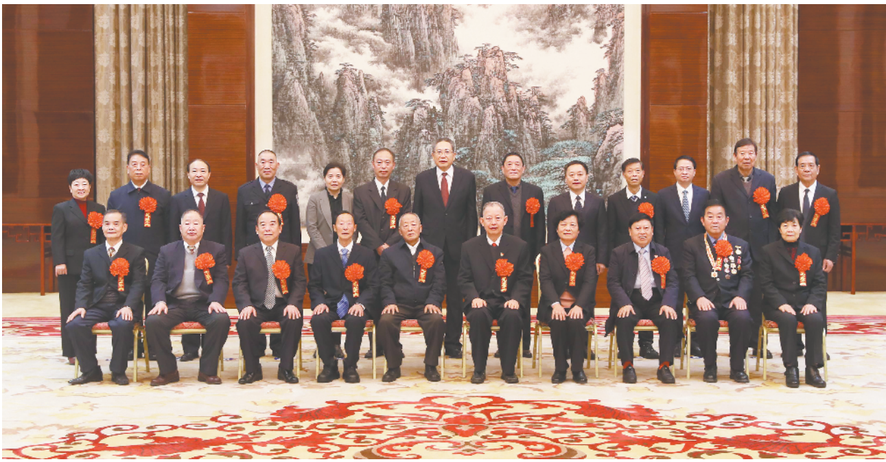
12月29日上午,省委书记李锦斌、省长李国英等省领导在合肥稻香楼宾馆会见了我省受表彰的全国、全省离退休干部先进集体和先进个人代表,并合影留念。

本报讯(通讯员 宗宋 记者 吴林红)12月29日上午,省委书记李锦斌在合肥会见我省受表彰的全国、全省离退休干部先进集体和先进个人代表。省委副书记、省长李国英,省领导丁向群、郭强参加会见。