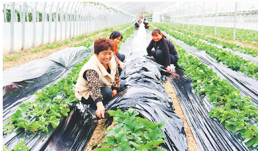
10月20日,淮北市濉溪县五沟镇国政村农户在水果园大棚里为过冬草莓进行覆膜防寒,为冬季生产做好准备。

省农业农村厅已下发通知,专项开展优质专用小麦生产和订单签订落实情况调度,重点抓落实,确保各项计划任务落实到位。整合各级财政资金2亿元,专项支持优质专用小麦生产,加快